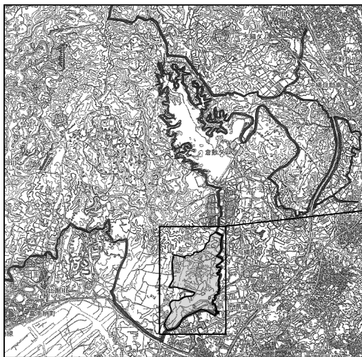
FAC6022 嘉手納弾薬庫地区

建物：倉庫施設及びスクールバスサービス関連施設等14棟 工作物：正門及び入門受付所、門、道路等