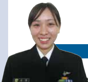
第 91 航空隊 山口県岩国市