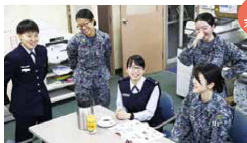
子育て制度が充実しています