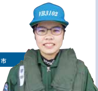
第 201 教育航空隊 山口県下関市

私は T-5 (初等練習機) で操縦訓練を受けています。20歳という若さで単独飛行を経験し、パイロットの第1歩を踏むことができました。将来は SH-60K (哨戒ヘリコプター) の操縦士として国内外の任務に従事することが私の夢です。