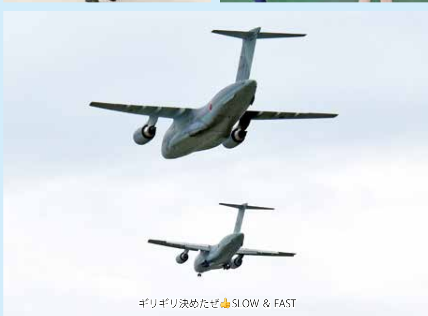
ギリギリ決めたぜ👉 SLOW & FAST