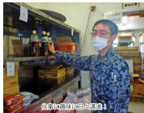
仕事に趣味に日々邁進！

他にも、広島には皆さんご存じ「牡蠣」や「お好み焼き」「尾道ラーメン」、世界遺産の「原爆ドーム」「厳島神社」など沢山の名物、観光名所があります。特に厳島神社の鳥居は、昨年12月まで3年半にも及ぶ大改修を終え、色鮮やかな朱色が蘇り、より一段と存在感が増しています。 ここからだとして、4時間程度で日帰りでも行ける距離にありますので、ぜひ足を運んでみてください！