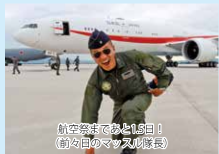
航空祭まであと1.5日! (前々日のマッスル隊長)