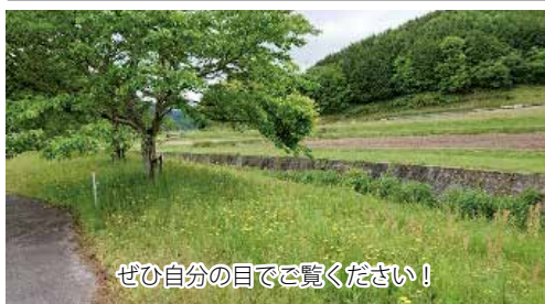
ぜひ自分の目でご覧ください！