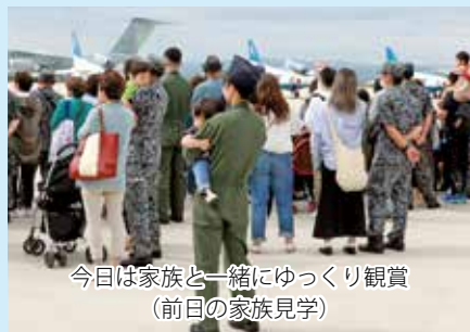
今日は家族と一緒にゆっくり観賞 (前日の家族見学)