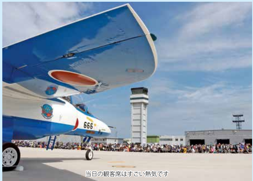
当日の観客席はすごい熱気です