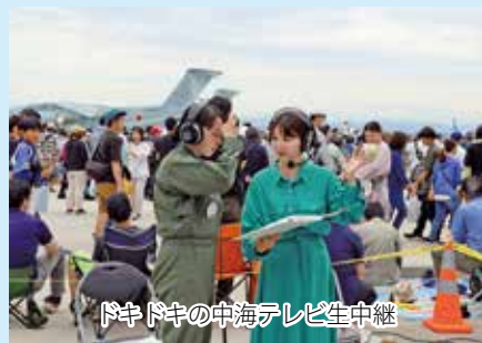
ドキドキの中海テレビ生中継