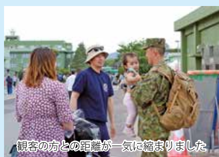
観客の方との距離が一気に縮まりました