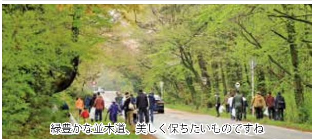
緑豊かな並木道、美しく保ちたいものです

ボランティア隊の活躍によって、あつという間に綺麗になった大山の表玄関である観光道路周辺。お陰でこれから始まる初夏のレジャーシーズンを気持ちよく迎えることができそう