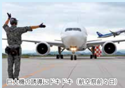
巨大機の誘導にドキドキ (航空祭前々日)