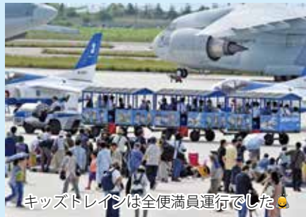
キッズトレインは全便満員運行でした👉