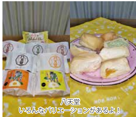
八天堂 いろんなバリエーションがあるよ！

抜群です。自然も豊かで、桜の名所である「御調八幡宮(みつぎはちまんぐう)」、瀬戸内海の島々と一緒に一望できる「筆影山展望台」「竜王山展望台」や紅葉の名所として「佛通寺」などがあります。写真撮るのが趣味の方、花が好きなお方にはきつと気に入っていただけたいと思います。また「八天堂」というクリームパン屋さんをご存じでしょうか？TVなどでたまに取り上げられていますが、パンはふわふわ、中にはクリームがぎゅっしり、けど甘すぎず飽きの来ないこれ以上ないクリームパンです！八天堂専門のカフェやスイーツも売っているお店もあり、スイーツ好きの方はぜひ食べてみてください！