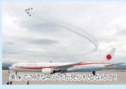
美保でこんなコラボが見られるなんて!