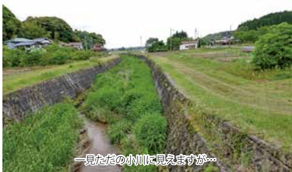
一見ただの小川に見えますが...

「だいせん新聞をご覧の皆様こんにちは。今回は私の出身地である広島県の観光地についていくつか紹介いたします。 まず初めに私の出身地である三原市です。広島県のほぼ中央に位置し、空港や新幹線、近くにはしまなみ海道など県内のみならず、県外や都心へのアクセスも