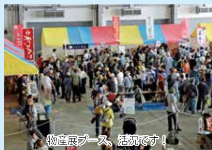
物産展ブース、活況です!