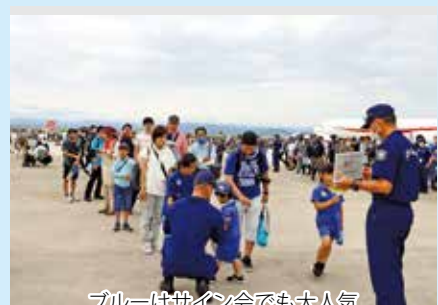
ブルーはサイン会でも大人気