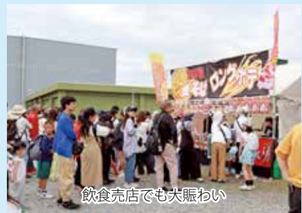
飲食売店でも大賑わい