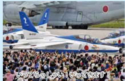
いってらっしゃい! いってきます!