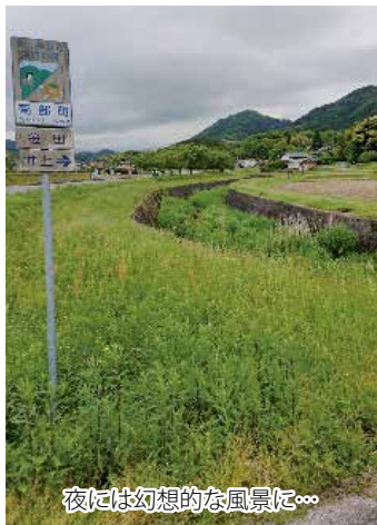
夜には幻想的な風景に...

「だいせん新聞」をご覧の皆様こんにちは。今回は、私の地元、鳥取県西伯郡南部町にあるレジャースポットについて紹介いたします。 写真の場所は、一見普通の山間部にある田んぼに隣接した川と見えますが、夜になると多くの幻想的な風景を見ることができ、私のおすすめ