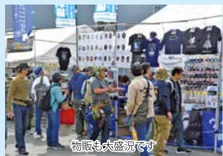
物販も大盛況です