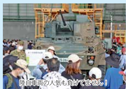
陸自車両の人気も負けてません!