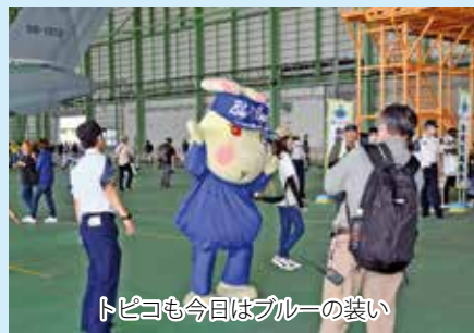
トビコも今日はブルーの装い