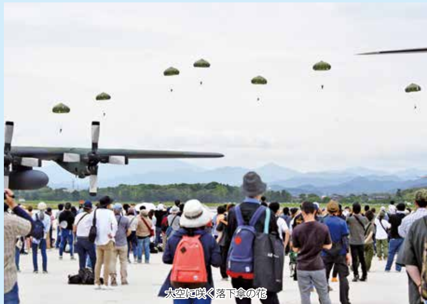
大空に咲く落下傘の花