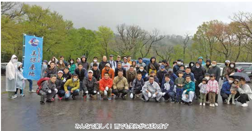
みんなで楽しく！雨でも笑みがとほれます

コロナ禍の影響で中止されて久しい大山「斉清掃ボランティア」が、いよいよ4月16日(日)に開催され、大山山麓の美化ローラー作戦にたくさんの方々が参加した。