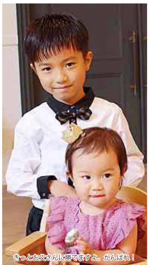
きっとお父さんに勝てますよ。がんばれ!