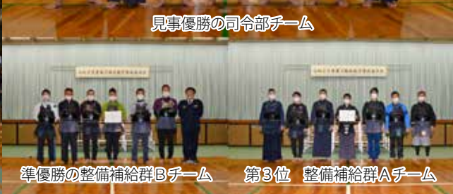
準優勝の整備補給群Bチーム 第3位 整備補給群Aチーム

「再就職の心構え」では、鳥取県中小企業労働相談所の方から労働法、労働契約、職場のメンタル等について解説して頂いた。 次に「生涯生活設計セミナー」では「シブラルタ生命から