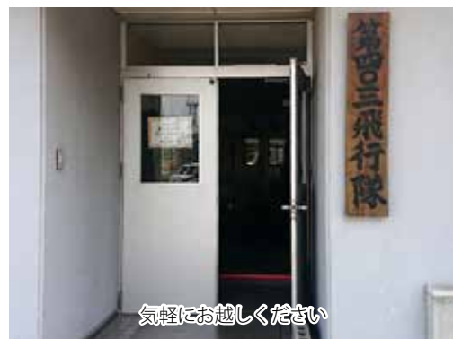
気軽にお越しください

基本が身につくと次に行うのは戦技訓練です。C2は民間の旅客機と異なり、上空で扉を開けて物料を空中投下できるようなついでに、皆さんもC2の物料投下を見たことがあると思います。ですが、戦技訓練は、災害地などに上空から物資を届けるため、指定された時間、場所に投下することを目標としており、私たちは1秒の誤差で70メートル落下点がズレる物料を、0メートルの精度で接地させることを追求して日々訓練を重ねています。その他にも、編隊飛行・低高度航法等、様々な内容を組み合わせた飛行訓練を行い、どのような任務にも対応できるように、日々訓練の維持向上に努めています。当然、このような訓練を安全に実施できるのも、それを支えて下さる美保基地隊員皆様の支えがあつたのもであり、私たちは皆様の感謝と、美保基地全体の期待を背負って飛ぶことにプライドを持っています。