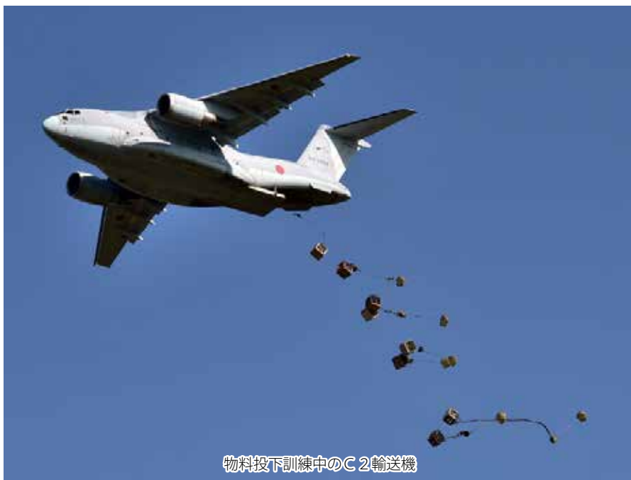
物料投下訓練中のC2輸送機

これは航空機を上手に飛ばすためだけではなく、片方のエンジンが停止した場合の対処や、航空機が速度を失う失速と呼ばれる状態から回復するための方法など、安全のために不可欠な操縦技術や、手足が勝手に動くほどに身体に叩き込みます。