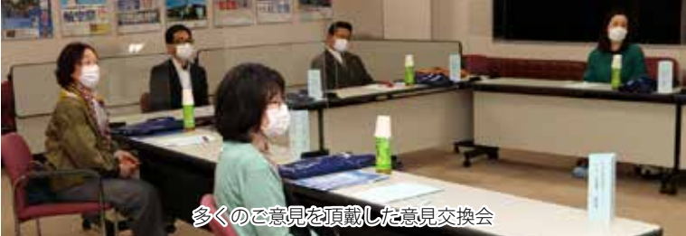
多くのご意見を頂戴した意見交換会

航空自衛隊に対するご理解を深めていただき良かったのですが、少ない行事にも積極的にご参加頂き本当に感謝しております。モニター活動終了後も引き続き、美保基地、そして航空自衛隊のご理解とご支援をよろしくお願い申し上げます。(要旨)と感謝の言葉を述べた。