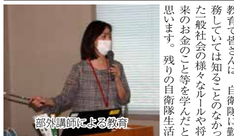
部外講師による教育

「再就職の心構え」では、鳥取県中小企業労働相談所の方から労働法、労働契約、職場のメンタル等について解説して頂いた。 次に「生涯生活設計セミナー」では「シブラルタ生命から