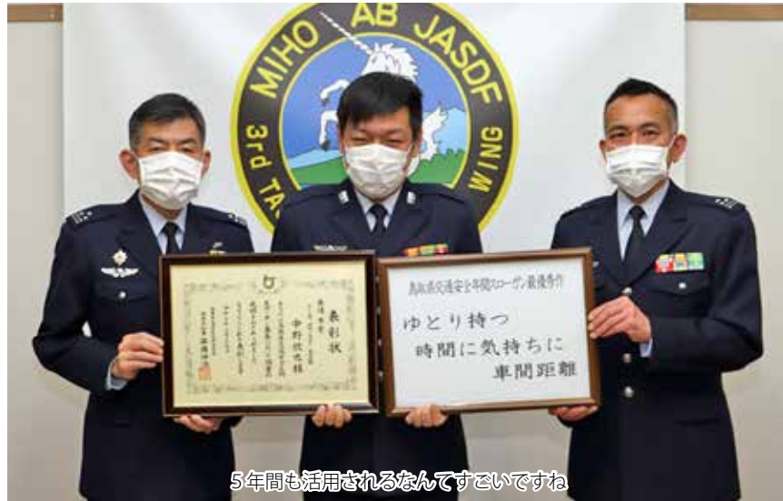
5年間も活用されるなんてすごいですね