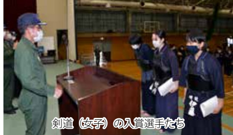
剣道(女子)の入賞選手たち