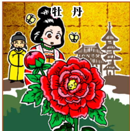
「百家の王」と呼ばれる中国原産の花・牡丹。お隣、島根県の大根島は牡丹の名産地です。

みなさん、いかがでしたでしょうか。まだまだ伝えきれない多くの魅力がある私のふるさと伊豆半島、コロナが収