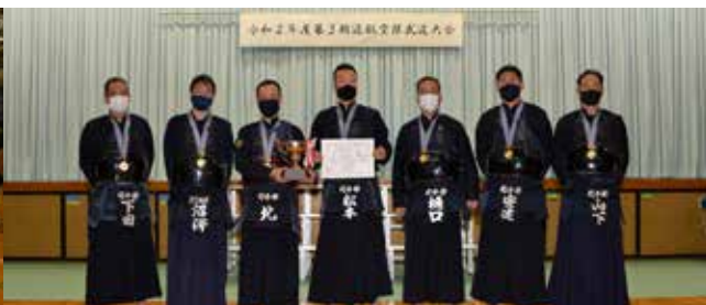
見事優勝の司令部チーム