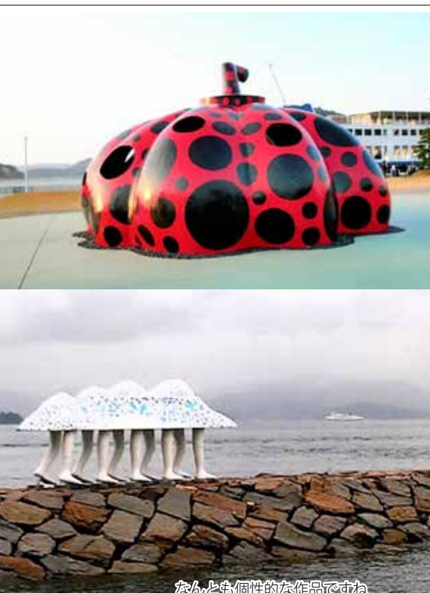
なんとも個性的な作品ですね