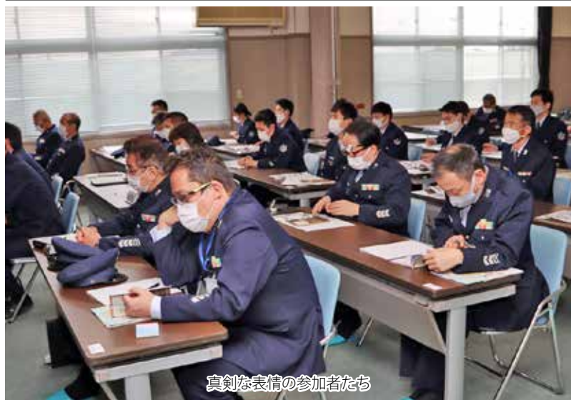
真剣な表情の参加者たち