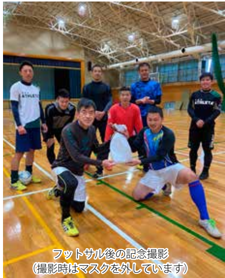
フットサル後の記念撮影 (撮影時はマスクを外しています)

心と超人的な体力を武器に府中基地でもサッカーを楽しんで頂きたいと思っています。只、怪我には十分気を付け、足を