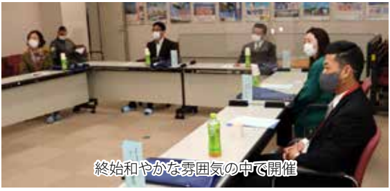
終始和やかな雰囲気の中で開催

航空自衛隊に対するご理解を深めていただき良かったのですが、少ない行事にも積極的にご参加頂き本当に感謝しております。モニター活動終了後も引き続き、美保基地、そして航空自衛隊のご理解とご支援をよろしくお願い申し上げます。(要旨)と感謝の言葉を述べた。