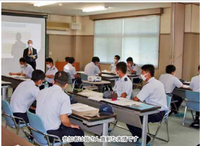
参加者は皆さん真剣な表情です

しくライトアップされた工場がいくつも並ぶ様子は「工場萌え」といっても過言なく、圧倒されることと思います。コロナ禍の影響ですが、屋形船による海上ツアーは一部催行されているようです。ご興味のある方は川崎市HP「フタタデイ・ツーリズムの勧め」をご覧ください。