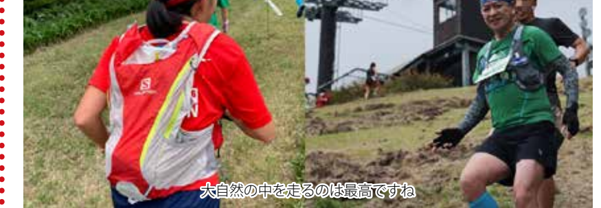
大自然の中を走るのは最高ですね

「大山」を盛り上げたい、元隊(笑)として参加しました。気にしたという想いで企画された「DAISEN GREEN RUN FES」に美保基地トレラン部も盛り上げがあり、ステイホームで運動不足気味な私はシングルにエントリー!万全なコロナ対策の基ウエーブスタート1組目で出発し、豪雨山のスキー場をややオーバーペースで下ります。上の原を指す頃は全集中の呼吸も途切れ、ゼイゼイとなり、後続スタートの選手にどんと抜かれ(泣)ほぼ歩きです。折り返し地点を過ぎると中の原を転がるように下るのがみ!なんとかゴールすることが出来ました。今回参加した給気K・Uコンビもダブルの部を無事完走!紅一点ロードマスター10隊員は4位入賞!!それぞれ久しぶりの大会を楽しむことが出来ました。コロナ禍において次々に大会が中止されるなか、安心・安全に大会を企画運営されたスタッフボランテイアの皆様に感謝です! 【ロマンスの神様】