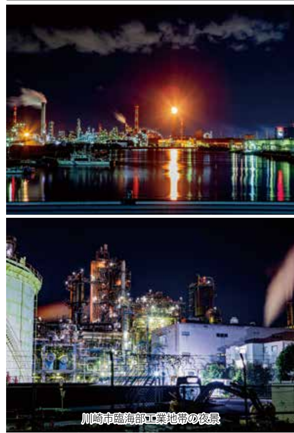
川崎市臨海部工業地帯の夜景

私のふるさと神奈川県川崎市は神奈川県東部の東部にあり、東京と神奈川に押しつぶされたように南北に細長い形をしています。皆様の中には川崎というと煙突から煙が出ている工場群、公害、歓楽街、治安が悪いイメージというイメージをお持ちの方がまだおられるかもしれません。(因みに川崎病という病名は川崎市とは関係がありません。)しかしそのような悪いイメージは臨海部の遙か昔のものであり、