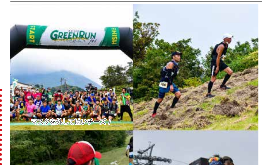
マスクを外してはいチーズ!

ぼくのお父さんは北九州から鳥取県に単身赴任中です。いつもいなので少し寂しいです。時々帰って来た時に一緒に釣りに行くのが楽しみです。お父さんが大きい魚を釣ることが僕の目標です。福岡県では魚があまり釣れないので、鳥取県に遊びに行つて釣ったことのない魚や大きな魚をお父さんと一緒に釣りたいです。