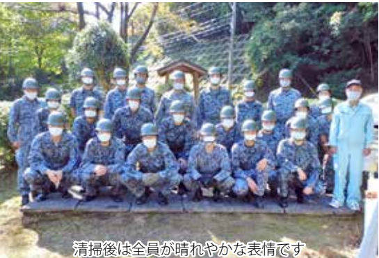
清掃後は全員が晴れやかな表情です

このような中、君たち9名は、これまでの部隊経験やその活躍ぶりが評価され、この新たな任務を担う飛行隊の先駆者として選ばれました。今後君たちには、航空機の配備に向け、一から新たな飛行隊づくりを進めてもらうこととなります。これから先、405飛行隊が、少しずつ、一歩ずつ伝統を積み重ねていくにあたり、どんなカラーの飛行隊に育てていくのかは、まさに皆さん次第です。どうか、初代405飛行隊の隊員として選ばれたことへの誇りと自信をもつて、これからの長い歴史を刻むこととなる405飛行隊を皆さんの色に染め、素晴らしい部隊に育てていってほしいと思います。」と訓示した。(要旨)