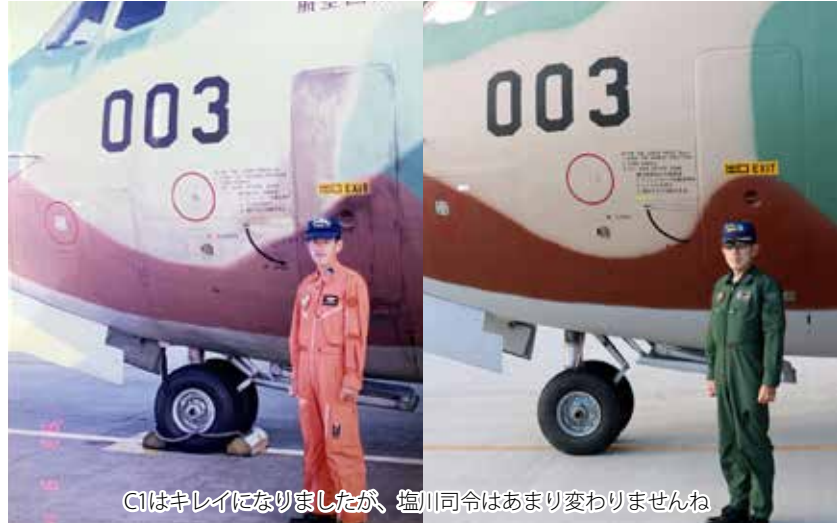
C1はキレイになりましたが、塩川司令はあまり変わりませんね

乱臣賊子とは、国を乱す家臣と、親不孝の子供のこと。昔、殷王朝の創始者である周文王は、洪水を止め、天下を平らかにした。殷王朝を倒した周公は、儒教の祖である孔子先生は春秋を制作された。孔子先生は春秋を制作された。孔子先生は春秋を制作された。孔子先生は春秋を制作された。