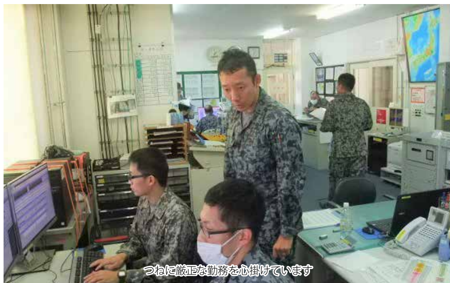
つねに厳正な勤務を心掛けています

レッシュな63歳から下はキーンと31歳と、幅広い年代層によって構成されています。 主な業務は気象予報、気象ブリーフィング、気象監視です。 気象予報においては、平日の6時から21時までの毎時間、美保飛行場の天気予報を最新の観測値に付加して発表しています。