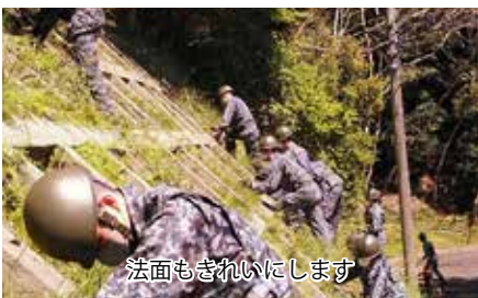
法面もきれいにします