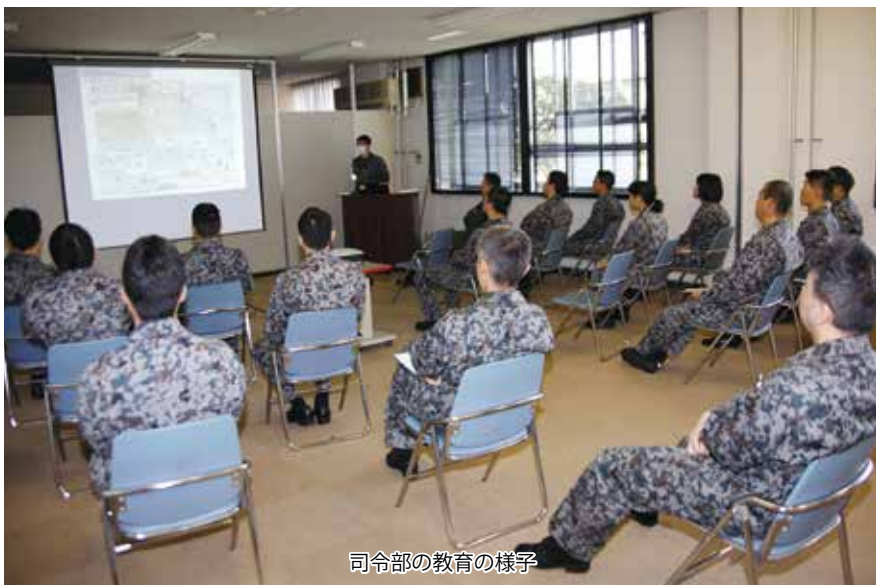
司令部の教育の様子

「航空支援集団安全の日」識させるため、毎年、年度は、平成28年4月に飛行点検隊のU125の航空大事故が発生したことをきっかけに、戦力保全の原点に立ち返り、尊い命の犠牲を伴った事故の教訓を継承し、安全に対する考え方を深く認識させるため、毎年、年度の始まりに実施されている。当日は、全隊員がそれぞれの勤務場所において、殉職隊員に対して黙とうを捧げた後、各部隊で安全教育が実施された。司令部での教育は3輸空