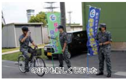
のぼりも新しくしました

この活動は隊員一人ひとりのベシツクマナーを徹底する。この活動は隊員一人ひとりのベシツクマナーを徹底する。この活動は隊員一人ひとりのベシツクマナーを徹底する。