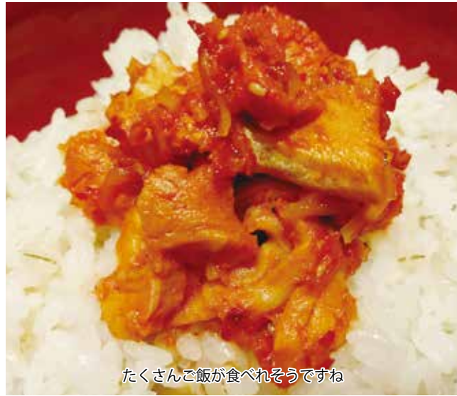
たくさんご飯が食べられそうですね

梅雨の雨が暗い出来事を洗い流し、明るく楽しい夏を迎えることが出来ることを祈ります。皆さん一緒に頑張りましょう！