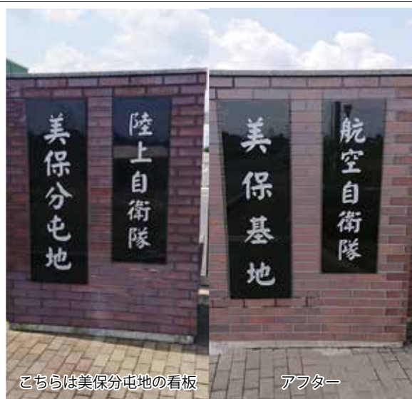
こちらは美保分屯地の看板

「だいせん」新聞をご覧の皆さん、美保基地正門の看板がお色直しになったことにお気づきでしょうか。 今年の2月25日から約1カ月を掛けて、正門に向けて、右側に掲示されていた「航空自衛隊」の看板が写真のように「航空自衛隊美保基地」とリニューアルされました。旧看板は、下半分が白く汚れ、見苦しい状態でありましたが、今回の工事でもキレイになり、基地を訪ねられた人達にも好印象を与えることは間違いのないものである。