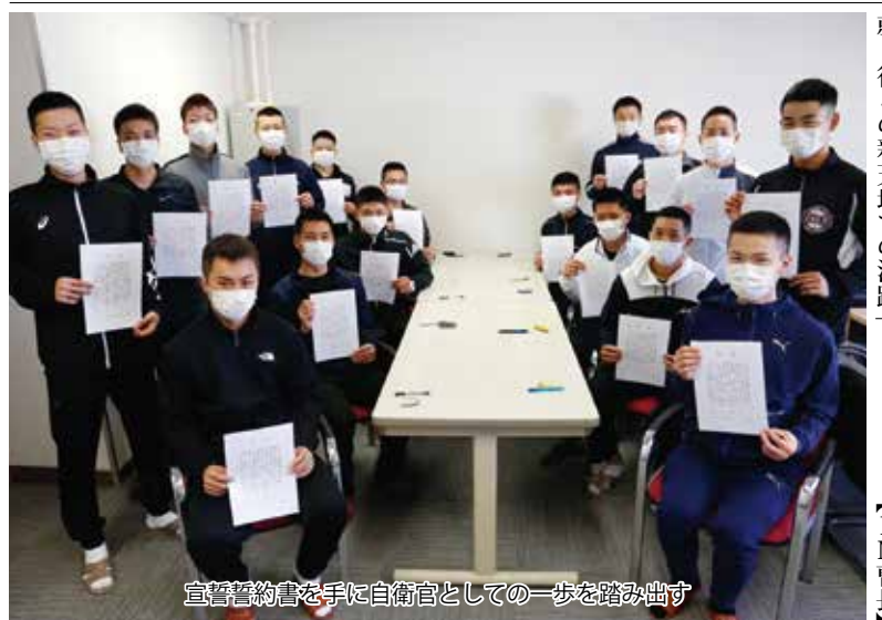
宣誓誓約書を手に自衛官としての一步を踏み出す