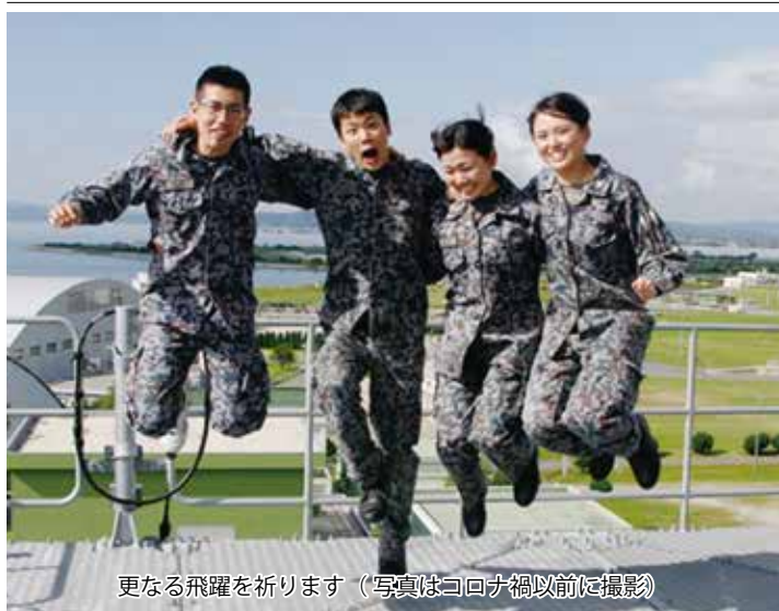
更なる飛躍を祈ります(写真はコロナ禍以前に撮影)

令和元年度美保管制隊では4名の新人管制官が誕生した。4名の隊員達は、一年近くの間、日々の訓練を経て、技量の向上及び知識の習得に努め、国土交通省の試験に挑み、無事に合格した。 今後に残る資格の習得に向け、厳しい