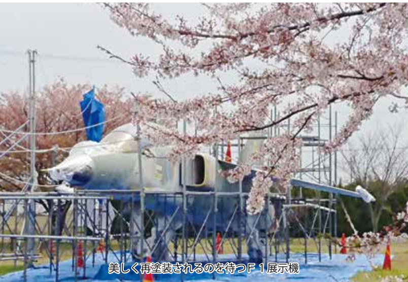
美しく再塗装されるのを待つF1展示機

ジンギスカンや海の幸、そしてサッポロ・ビール等、たくさんのおいしいものが思い浮かぶと思います。しかし、皆さんは「鮭キムチ」という商品があることをご存じですか？鮭キムチとは、その名の通りたつぷりの鮭とキムチを組み合わせた商品です。旨味とコクが詰まった鮭の脂と、ピリッとしたキムチ独特の辛さが見事にマッチしているのが、ご飯を何杯もおかわりすることが出来ます！(笑)もちろんご飯だけでなく、お酒との相性も格別ですので、鮭キムチをつまみに、サッポロ・