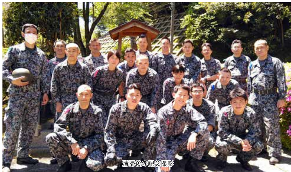
清掃後の記念撮影

美保基地及び高尾山分屯基地は5月8日(金)、21名の隊員が参加し、島根県出雲市久多見町にある護国延命地蔵尊周辺の環境整備を行った。環境整備は翌週11日に同地で開催される慰霊法要を前に周辺の環境を整備することを目的として実施された。環境整備当日は天候に恵まれ、心地良い春風が吹く中で実施された。 隊員達は延命地蔵尊と周辺道路さらには、延命地蔵尊を挟んだ山の法面に生えた雑草や落ち葉等を丁寧に拾い集め清掃前とは見違えるほどきれいになった。 清掃に参加した隊員達からは「毎回、環境整備への参加を楽しみにしています。特に護持委員会の方々や久多見の皆さんと交流出来るのが楽しみでしたが、今回は新型コロナウイルスの影響でお会い出来ないのがとても残念です。一日も早く新型コロナウイルスの騒動が鎮静化し、皆さんにお会い出来る日が来ることを望んでいます。」との感想が聞かれた。