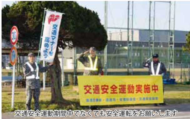
交通安全運動期間中だけでなく安全運転をお願いします

初日は、各隊の先任、上級空曹たちが登庁時、正門をはじめ基地内各所に立ち、登庁してくる隊員たちに対して「おはようございます。」と元気よく声を掛けました。期間中は、各隊員が靴磨きや作業服のアイロン、頭髪の手入れ等、さらに職場の整理整頓や基地内の環境整備が実施され、普段にも増して働きやすい勤務環境を整備することが出来た。