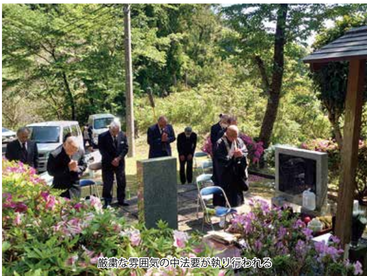
厳肅な雰囲気の中法要が執り行われる

後、地元の方々のご尽力により事故現場付近に延命地蔵尊が建立され、毎年、3名の殉職隊員に対する慰霊追悼行事が執り行われている。例年、美保基地、築城基地等から多くの隊員が参列し、英霊に対し追悼の誠を捧げているが、今年は世界的に流行している新型コロナウイルスの影響で出雲市内でも感染者を確認したため多数の隊員が集合することが出来なくなつたことから、護国延命地蔵尊護持委員会の方々のみで52回忌法要を挙行して頂いた。