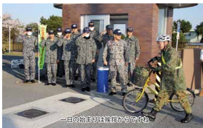
一日の始まりは挨拶からですね

4月6日(月)〜10日(金)までの間、美保基地は「航空自衛隊 挨拶・清掃・身だしなみ」励行週間の活動を実施した。