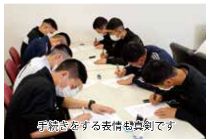
手続をする表情も真剣です

3月30日、4月1日まで3日間、美保基地は鳥取県から入隊する令和2年度航空自衛隊入隊予定者(自衛官候補生)17名の最寄り入隊を支援した。 最寄り入隊とは、入隊時に必要な身体検査をはじめ各種事務手続き等、数百人の業務が集中する教育隊(防府南基地)の負担を分散化させるため、入隊予定者に対し、あらかじめ指定された基地がその業務を行う。