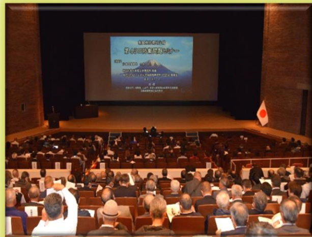
防衛問題セミナー会場の様子

令和8年5月22日（金）御殿場市民会館（静岡県御殿場市）において、南関東防衛局主催による「第45回防衛問題セミナー」を開催しました。御殿場市開催は、2008年（平成20年）「第9回防衛問題セミナー」以来、18年ぶり2回目で、開催当日のセミナー会場には、多数の地域の方々や関係団体の方々の来場を賜りました。