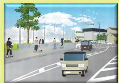
市道拡幅後のイメージ