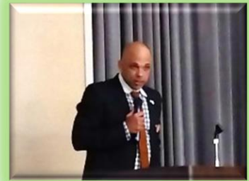
在日米陸軍 トラウマシュー危機管理室長