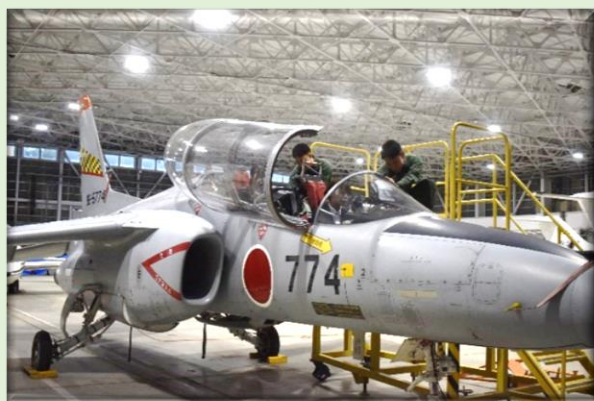
操縦席でパイロットから説明を受ける研修生（浜松基地）