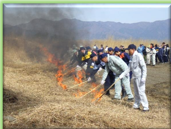
来賓による点火セレモニー