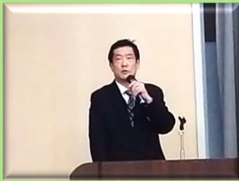
神奈川県警察本部 算危機管理対策課長（当時）

令和8年2月25日（水）神奈川県横浜市中区横浜第2合同庁舎内において、第39回航空事故等連絡協議会年次総会が開催され、日米の23機関から約80名が出席しました。本協議会は、昭和52年に神奈川県横浜市緑区で発生した航空機墜落事故を契機に、県下における米軍又は自衛隊による航空事故、その他不測の事故及び事故に伴う災害が発生した場合に備え、関係機関相互の迅速な連絡調整体制を整備し、総合的な応急対策の実施について連絡協議することを目的に、昭和62年1月20日に発足し、今年で39年目を迎えました。