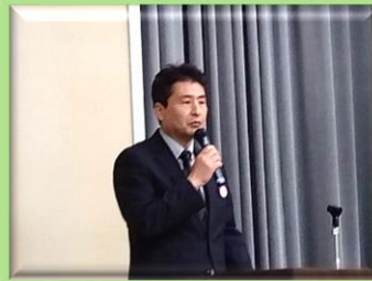
川崎市 小田危機管理対策部 訓練担当課長（当時）