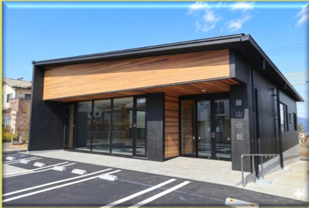
完成したコミュニティ供用施設鐘山会館の正面