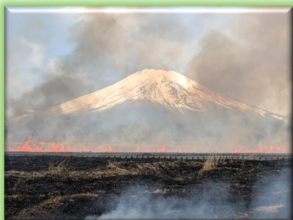
富士北麓に立ち昇る炎と煙

令和8年4月12日（日）陸上自衛隊 北富士演習場（山梨県 富士吉田市他）の国有入会地において、富士吉田市外二ヶ村恩賜県有財産保護組合及び旧11ヶ村入会組合の主催による恒例の「火入れ」が行われました。この「火入れ」は、薬草・山野菜等林野雑産物の保護育成、害虫駆除、野火の発生防止等を目的とし、草木が芽吹く前にススキ等の枯草を焼き払うもので、富士北麓の春の訪れを告げる伝統行事です。当日は天候にも恵まれ、午前9時の花火の合図とともに、一斉に点火作業が開始され、約2,800名の地元入会組合員の方や、富士五湖消防本部、地元消防団、陸上自衛隊等による協力の下、約1,900haの火入れが無事に実施されました。