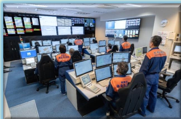
消防指令システム

当該施設の運用に使用されるシステムの一部は、当省の補助事業（民生安定施設整備事業）により整備費の一部を助成したもので、これにより4市にまたがる消防活動の円滑化が図られ、地域住民の皆様の生命と財産を守ることが期待されます。