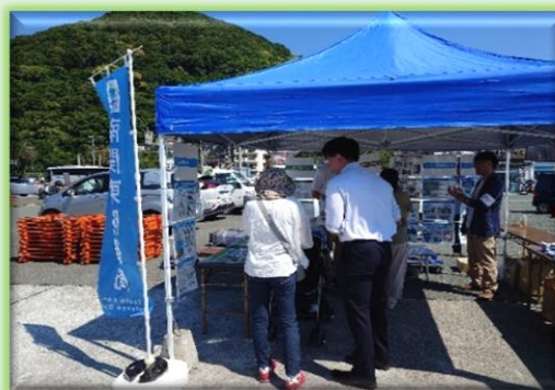
広報展示ブースの様子