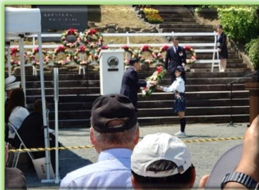
記念式典 花輪奉献の様子

例年、駐日米国大使、在日米海軍司令官をはじめとする米国・米軍関係者のほか、海上自衛隊 横須賀地方総監部等から自衛隊関係者も多数参加しています。また、南関東防衛局からは鋤先局長が記念式典などに参加しました。