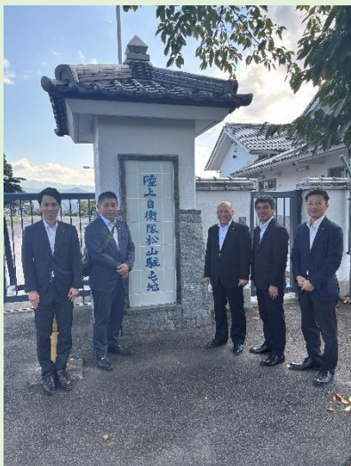
松山駐屯地での集合写真

令和7年10月8日（水）、座間市議会議員5名の皆様が陸上自衛隊松山駐屯地に赴き、松山駐屯地および広報資料室を見学しました。松山駐屯地の概要説明では、特に、防衛・防災両面の観点から任務や活動内容、地域社会との交流や連携、また、駐屯地としての取組内容等についての説明を受けました。