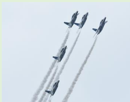
曲技飛行中のブルーインパルス

また、毎年行われているブルーインパルスの曲技飛行は、天候の影響により演目が一部変更となりましたが、多彩な曲技飛行が披露され観客を魅了しました。