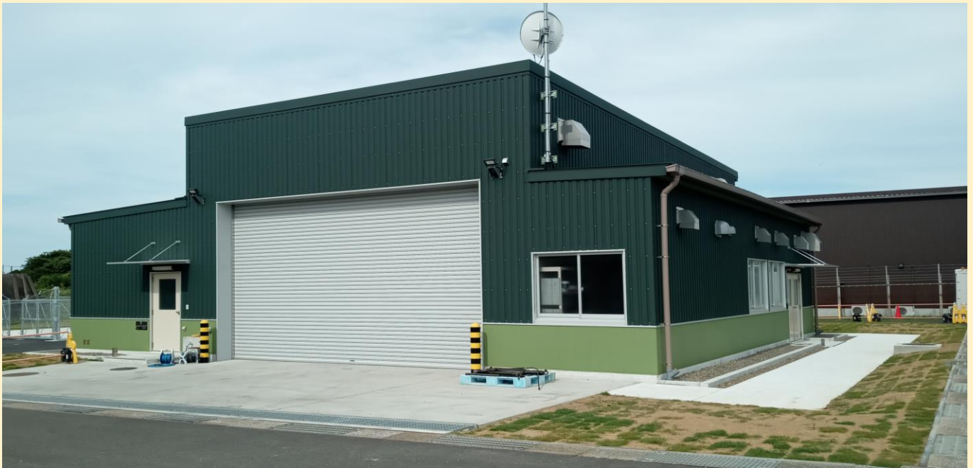
自動車修理工場（車両搬入口側）

昭和45年に建設された自動車修理工場は、数回の部分改修を行いながら55年間の長きにわたり使用されてきましたが、塩害に因る鉄骨の主要構造部材の腐食が著しく、部分改修による建物維持が困難となったことから、新たに鉄骨造1階建て延べ床面積約180平方メートルの自動車修理工場として整備されたものです。