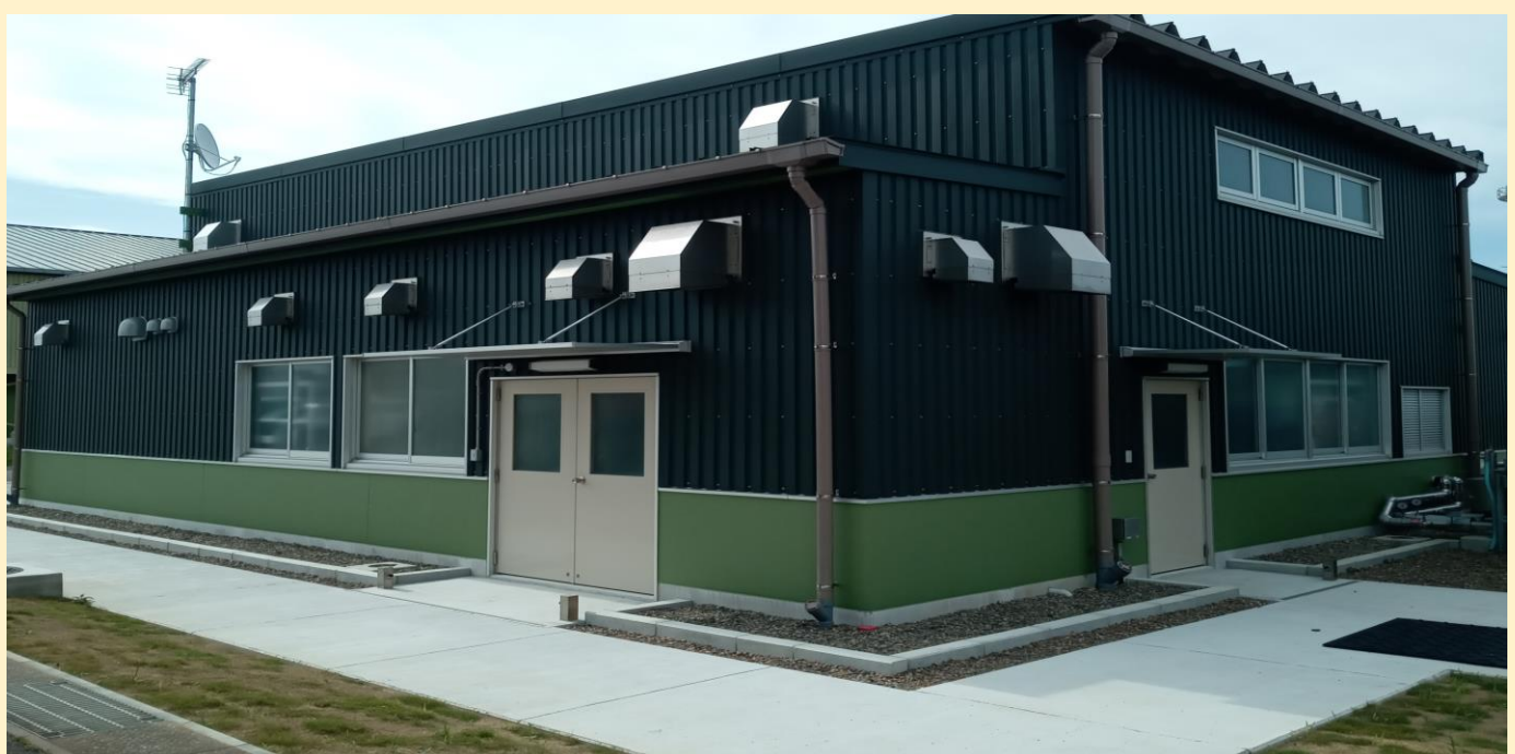
自動車修理工場（事務所入り口側）