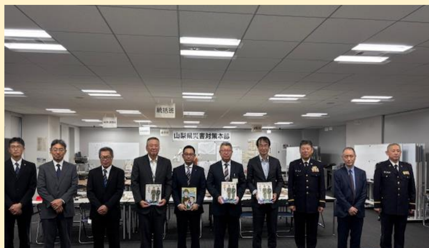
山梨県防災局長説明時