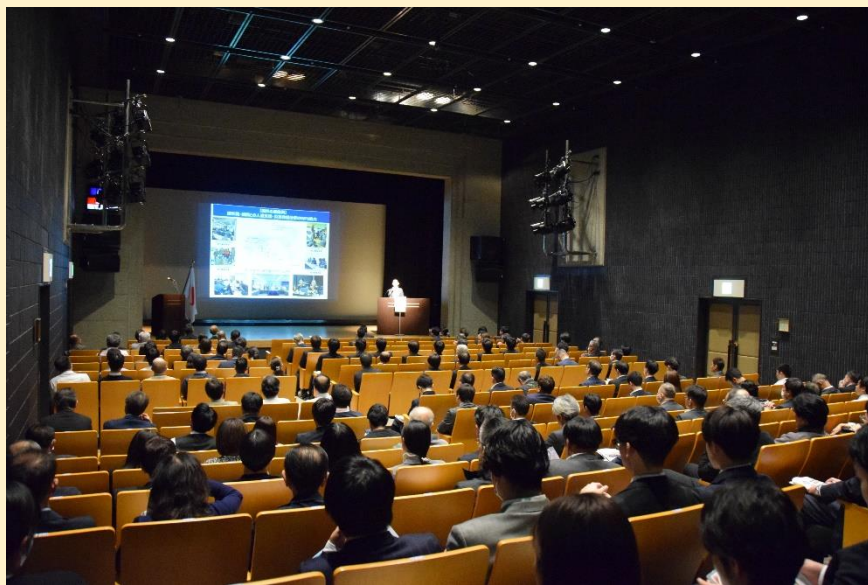
防衛問題セミナー会場の様子