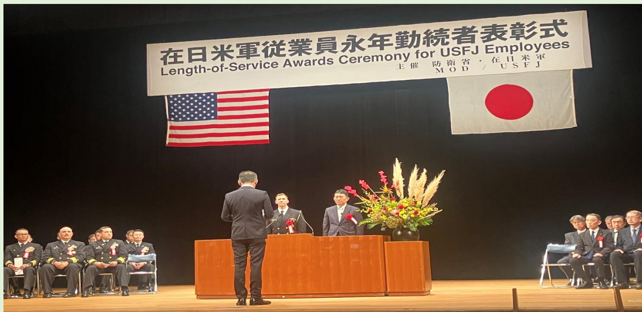
横須賀市文化会館での式典の様子

在日米軍従業員に対する永年勤続表彰は、横須賀海軍施設、厚木海軍飛行場、キャンプ座間、相模総合補給廠、キャンプ富士等、南関東防衛局管内の在日米軍施設に勤務されている在日米軍従業員のうち、勤続期間が10年、20年、30年及び40年に達した方々の永年の功労を称えるため、毎年10月に日米共催で実施しているものです。