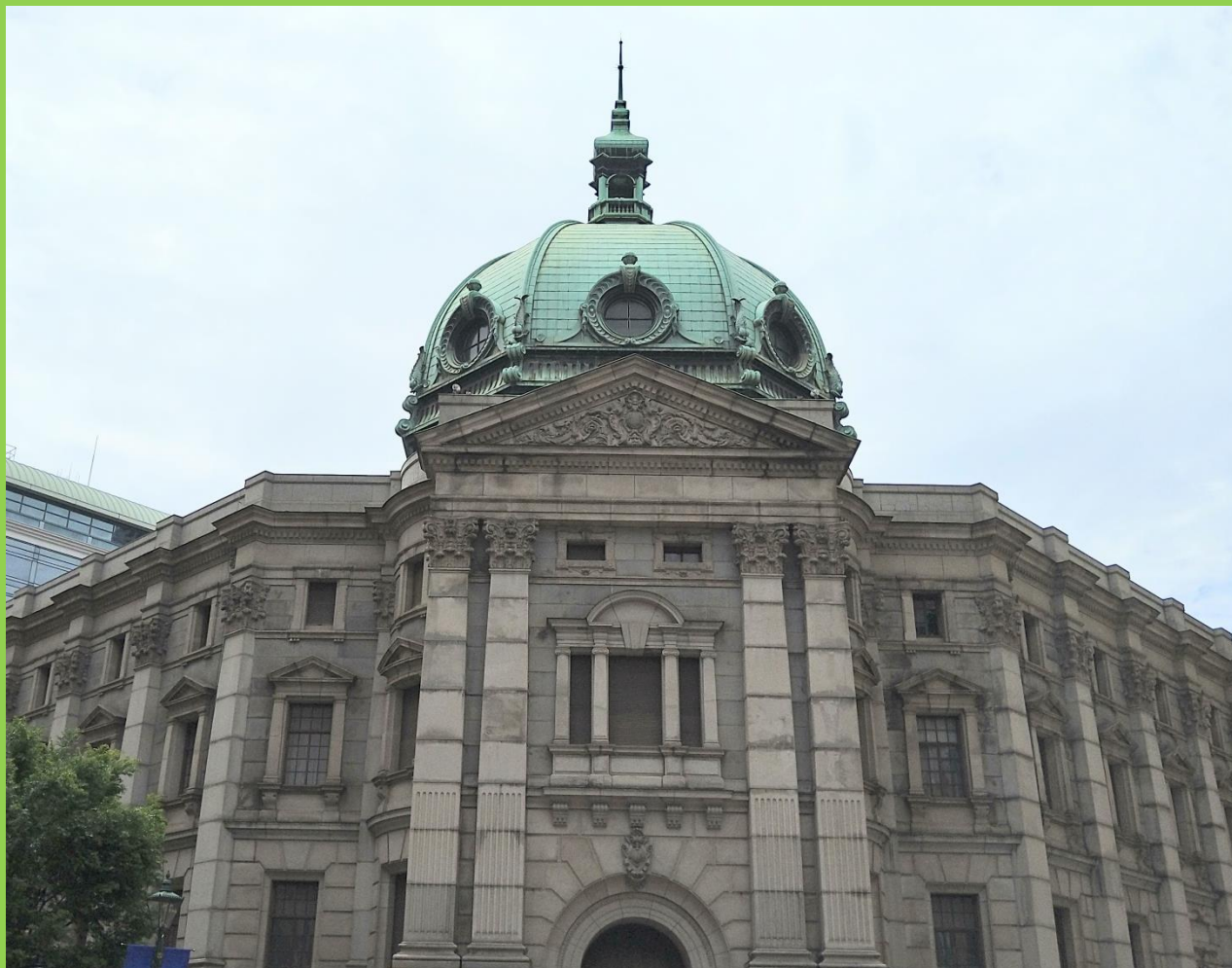
神奈川県立歴史博物館