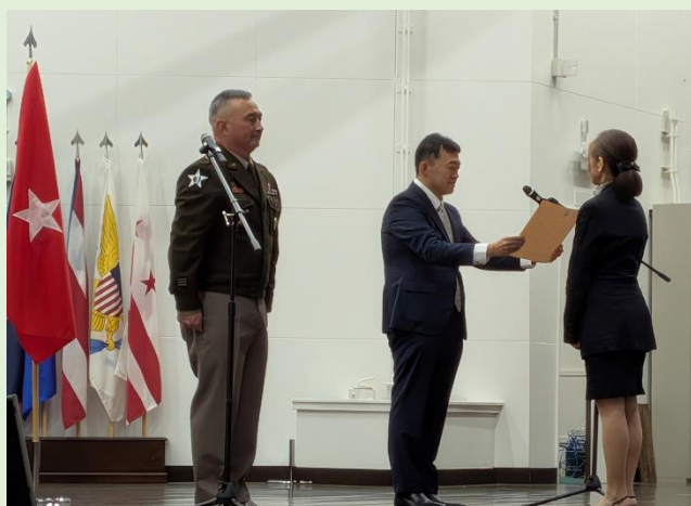
キャンプ座間内 絆ホールでの式典の様子

受賞にあたり、横須賀地区において10月17日（金）に横須賀市文化会館、座間地区において10月24日（金）にキャンプ座間内の絆ホールでの2地区において永年勤続表彰式が開催されました。