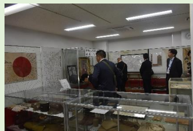
松山駐屯地内の見学