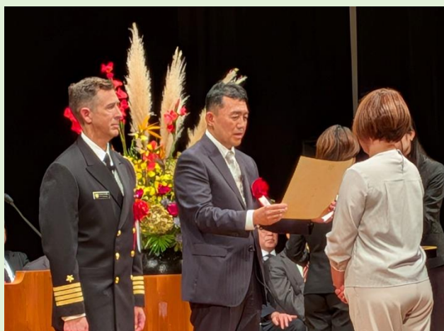
横須賀市文化会館での式典の様子

式典においては、来賓として神奈川県を初め、それぞれの地区において横須賀市、座間市を代表する方々にご臨席いただき、日米両国の国家吹奏に始まり、主催者挨拶として南関東防衛局長ならびに各軍の司令官等がそれぞれ式辞を述べられました。