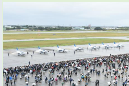
地上展示中の機体