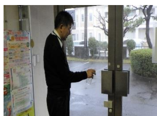
手作りの消毒液で事務所内を除菌