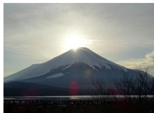
ダイヤモンド富士