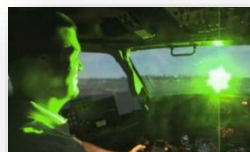
■レーザー光線による操縦士への影響（イメージ）

神奈川県内や東京都内で飛行中の航空機に対してレーザー光線を照射するという事案が多発しています。航空機へのレーザー光線の照射は、パイロットの目の負傷、失明、操縦への障害に繋がり、 墜落等による大惨事を地域の皆様にもたらしかねない大変危険で悪質な行為 です。