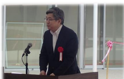
小波南関東防衛局長 (竣工式：令和2年7月3日)