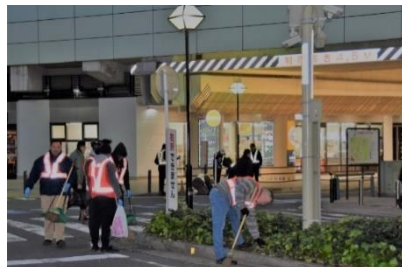
写真：大和駅前を清掃する米海軍厚木基地の軍人ボランティア達