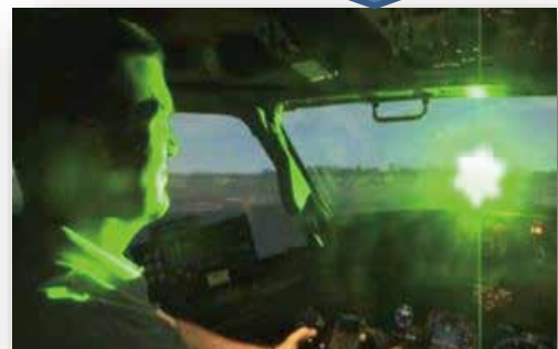
■レーザー光線による操縦士への影響（イメージ）

レーザー光線の照射により航空機の安全な運航を妨害することは犯罪です。 （最も重い刑で懲役3年（注））