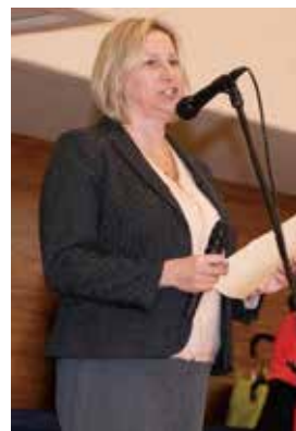
ハースト・サリヴァンズ小学校長

本イベントでは、南関東防衛局の若手職員10名が、日米の子供たちのお手伝いをすべく、子供たちのお兄さん、お姉さん役として参加しました。