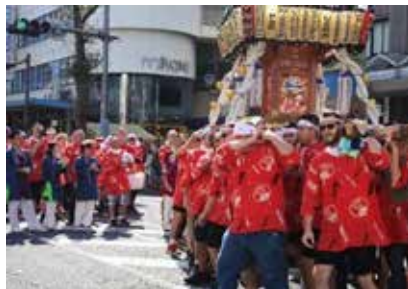
よこすかみこしパレードで神輿を担ぐ米海軍人たち