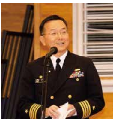
キム米海軍横須賀基地 司令部司令官