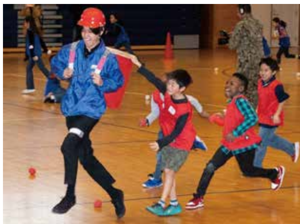
追いかけて玉入れで カゴにボールを入れる子供たち

当日は、横須賀市内の小学生と横須賀海軍施設の小学生計81名が、チームごとに分かれて、名刺交換をしたり、大縄跳び、追いかけて玉入れ、綱引き、クイズ、ペア探しゲームを行いました。また、昼食時には、やきそば、フランクフルト、おにぎりをみんなで楽しく食べました。