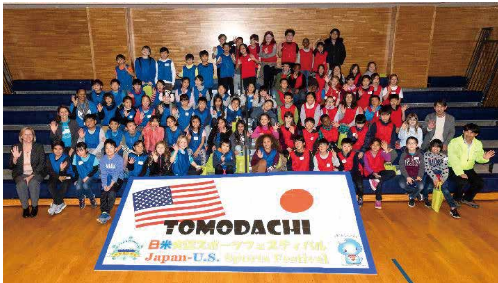
完成したメッセージボードの前で記念撮影

今回の日米交流事業は、共催である横須賀市、米海軍横須賀基地司令部及びサリヴァンズ小学校のご協力により、盛大に催すことが出来ました。