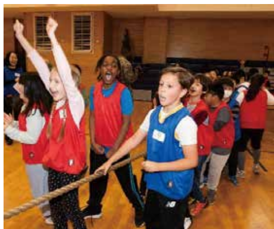
綱引きに勝って喜ぶ子供たち