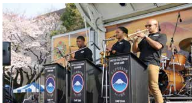
場内特設ステージでは在日米陸軍音楽隊がトランペット演奏も披露