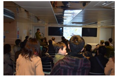
写真：第31普通科連隊の講話会場