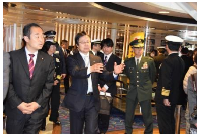
写真：「自衛隊の災害派遣」講話会場を視察