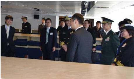
写真：船内の説明を受ける宮澤防衛大臣政務官