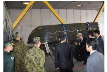
写真：展示装備品（陸自・座間：第4施設群：渡河ボート）の説明