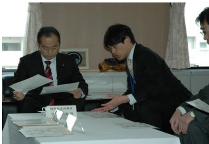
写真：中央：宮澤防衛大臣政務官、左：堀地南関東防衛局長