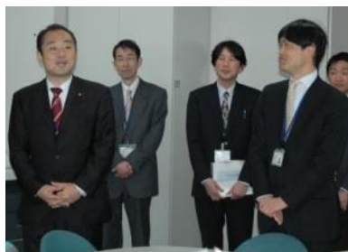
写真上（左右）宮澤防衛大臣政務官による執務室内見学、激励