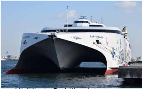
写真左右：ナッチャンWorld