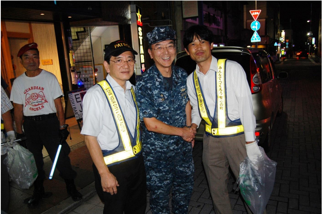
左: 上田町内会代表 中央: ジェフリー・キム司令官 右: 堀地南関東防衛局長

9月16日、神奈川県横須賀市の繁華街において、地元町内会、神奈川県、横須賀市、米海軍横須賀基地、ガーディアン・エンジェルス（各地でパトロールを実施するNPO）、横須賀警察署、海上自衛隊横須賀地方隊及び南関東防衛局が参加して、夜間巡回パトロールが実施され、米海軍からはジェフリー・キム司令官夫妻ほか、南関東防衛局から堀地局長ほか参加しました。