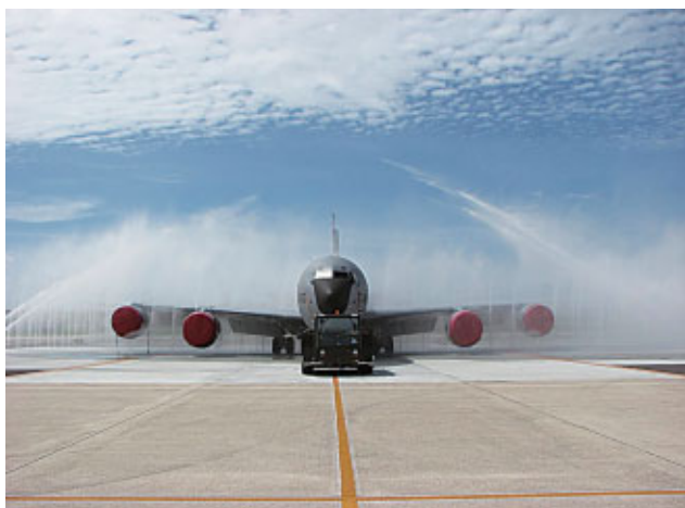
洗機施設の早期移転実施に伴い空軍大型駐機場地区に移転された洗機施設