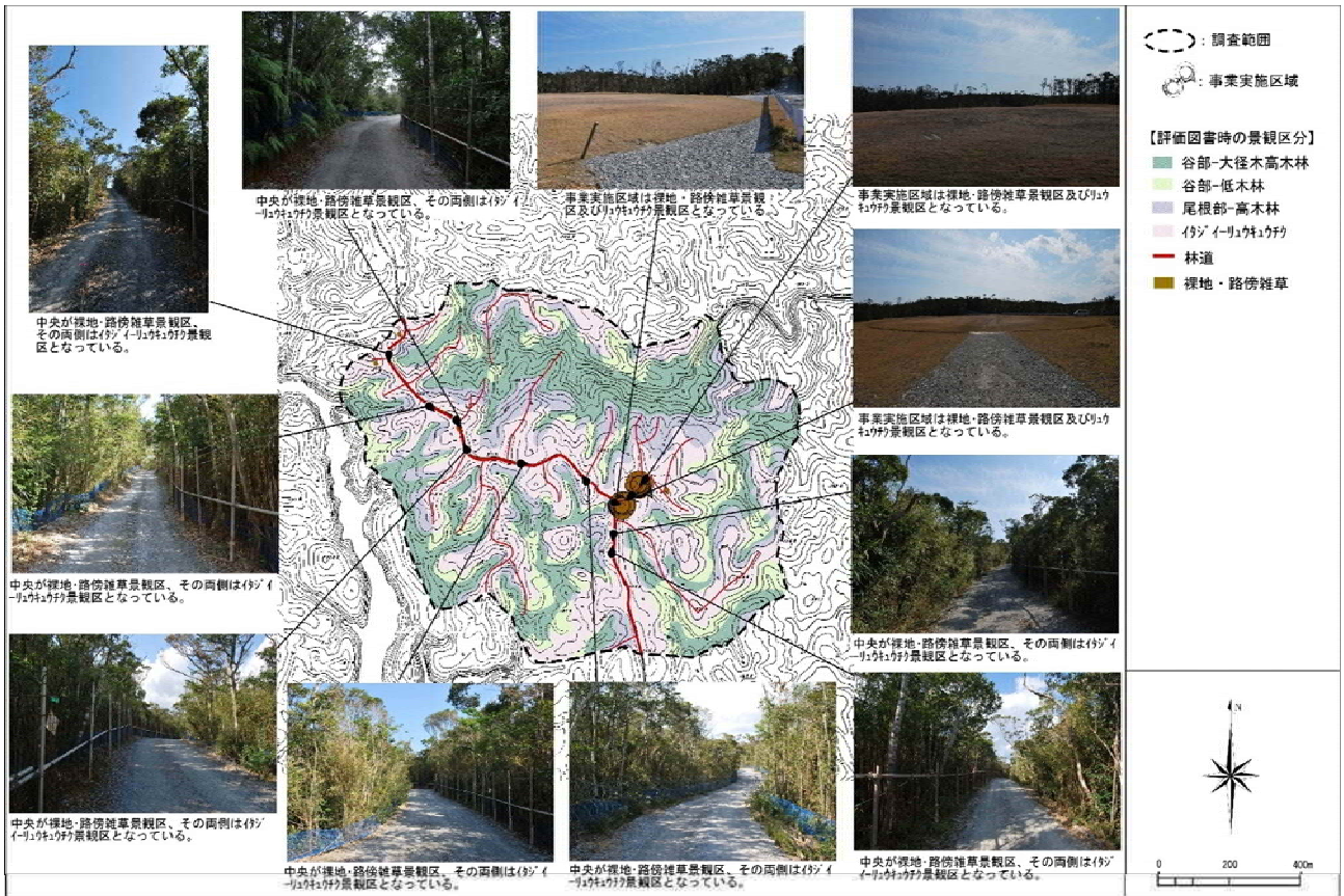
図 7.1.6-11 N-1 地区における眺めの状況（平成 29 年度：冬季）