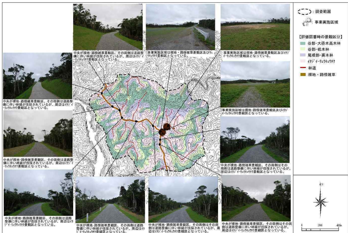
図 7.1.6-14 N-1 地区における眺めの状況（令和 2 年度：春季）