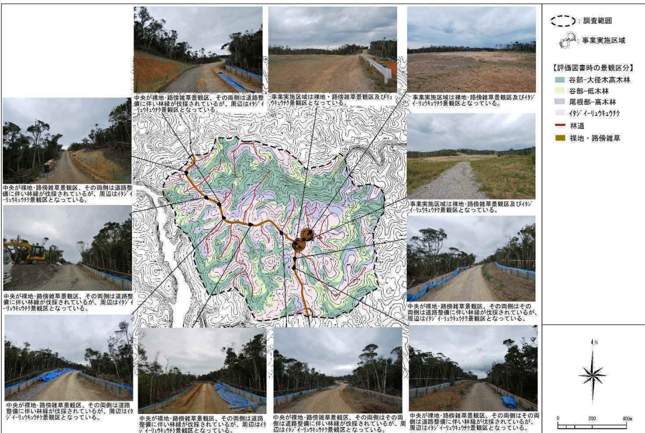
図 7.1.6-13 N-1 地区における眺めの状況（令和元年度：冬季）