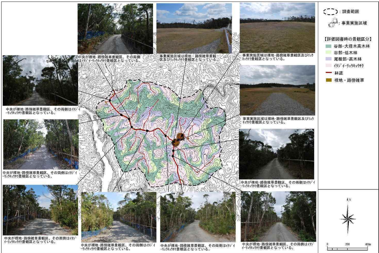
図 7.1.6-12 N-1 地区における眺めの状況（平成 30 年度：冬季）