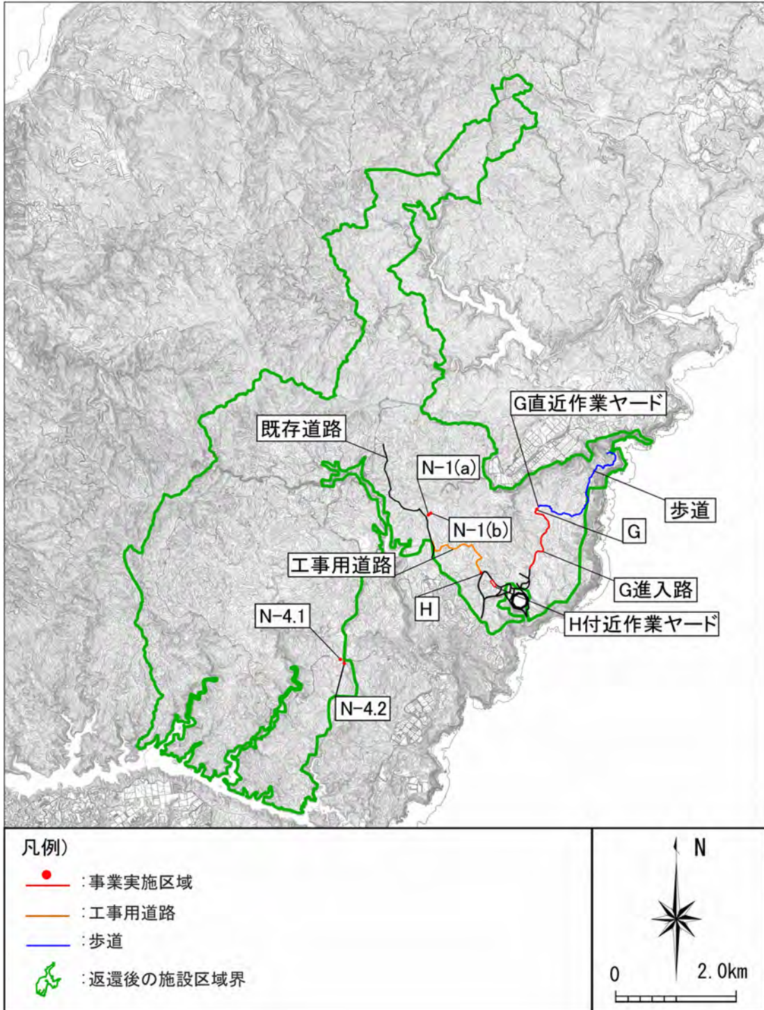
図 9.1-1 事業実施区域及びその周辺位置図(4地区計6ヶ所)