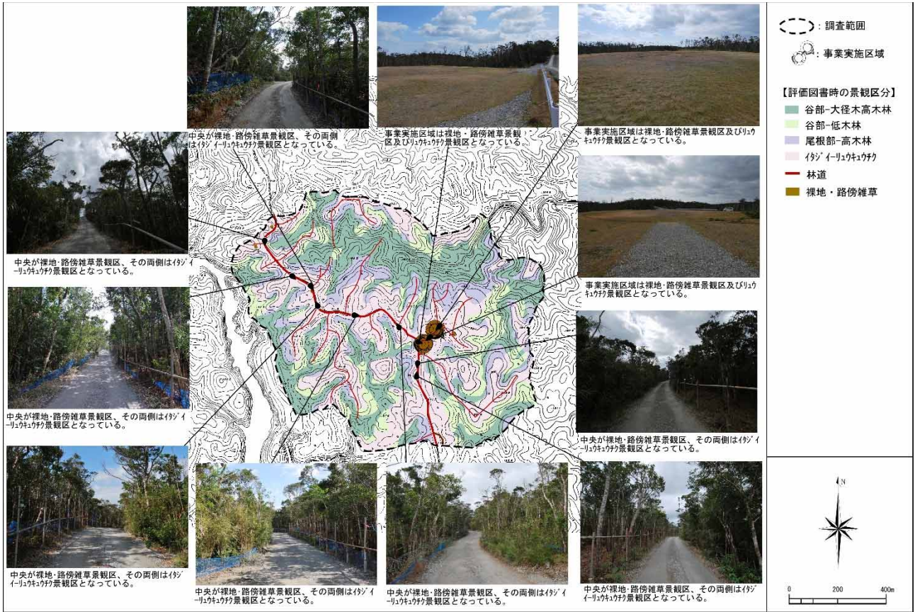
図 7.1.6-9 N-1 地区における眺めの状況（平成 30 年度：冬季）