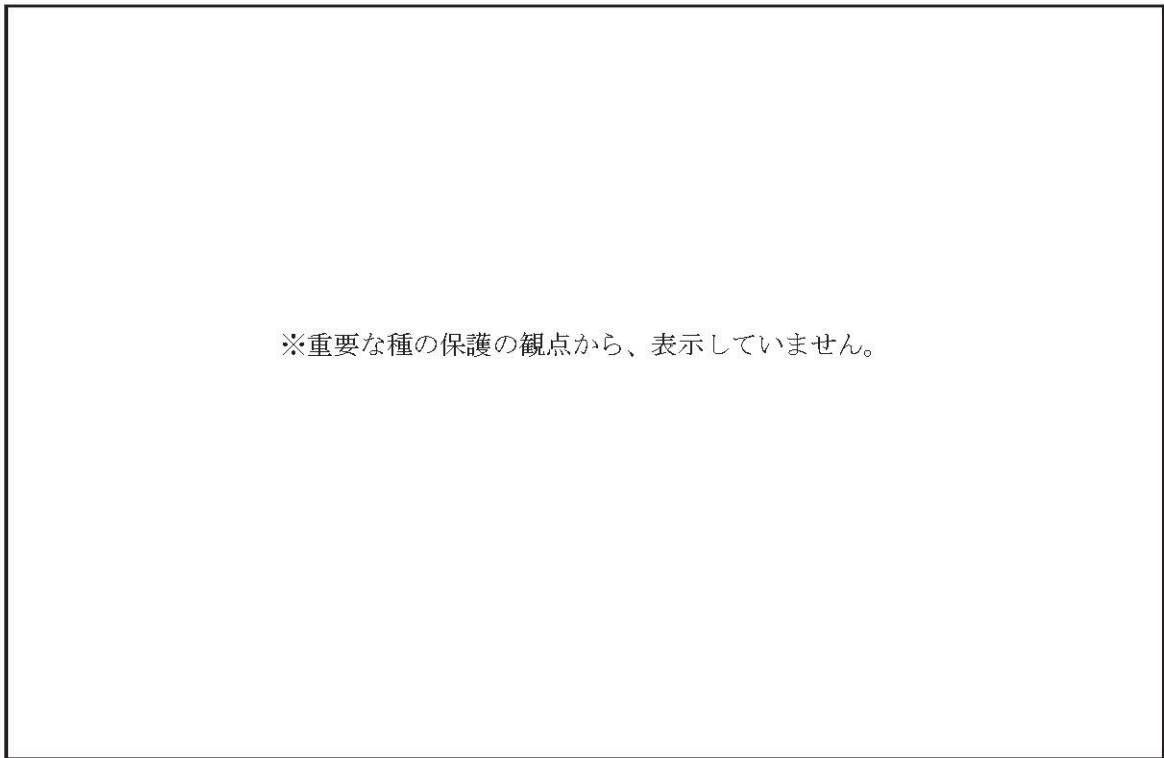
リュウキュウトンボ