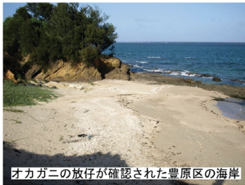
オカガニの放仔が確認された豊原区の海岸