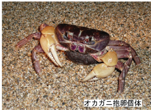
オカガニ抱卵個体