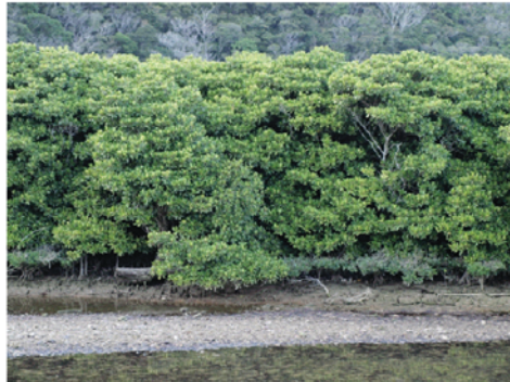
大浦川のマングローブ林