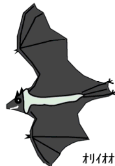
オリオオコウモリ