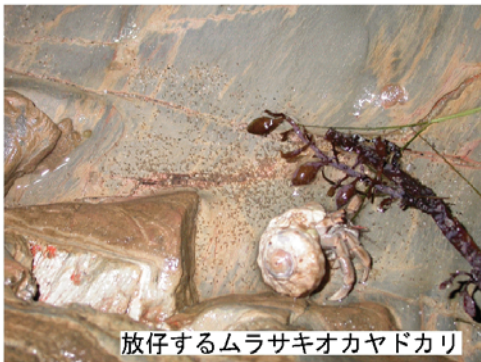
放仔するムラサキオカヤドカリ