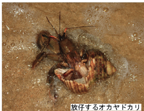
放仔するオカヤドカリ