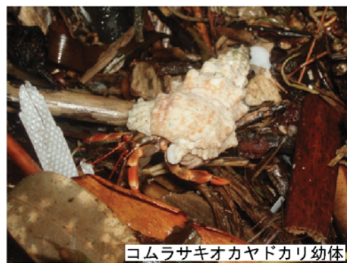
コムラサキオカヤドカリ幼体