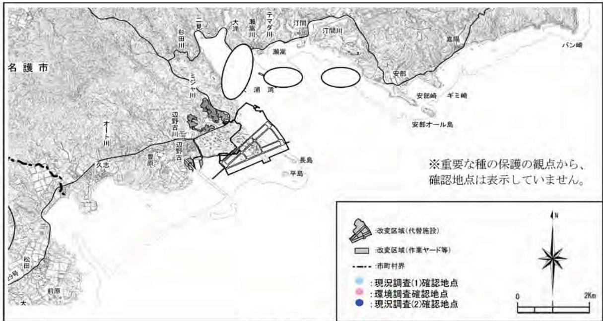
スエヒロガイの確認地点