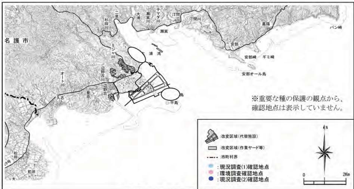
ヒメヒラシイノミガイの確認地点