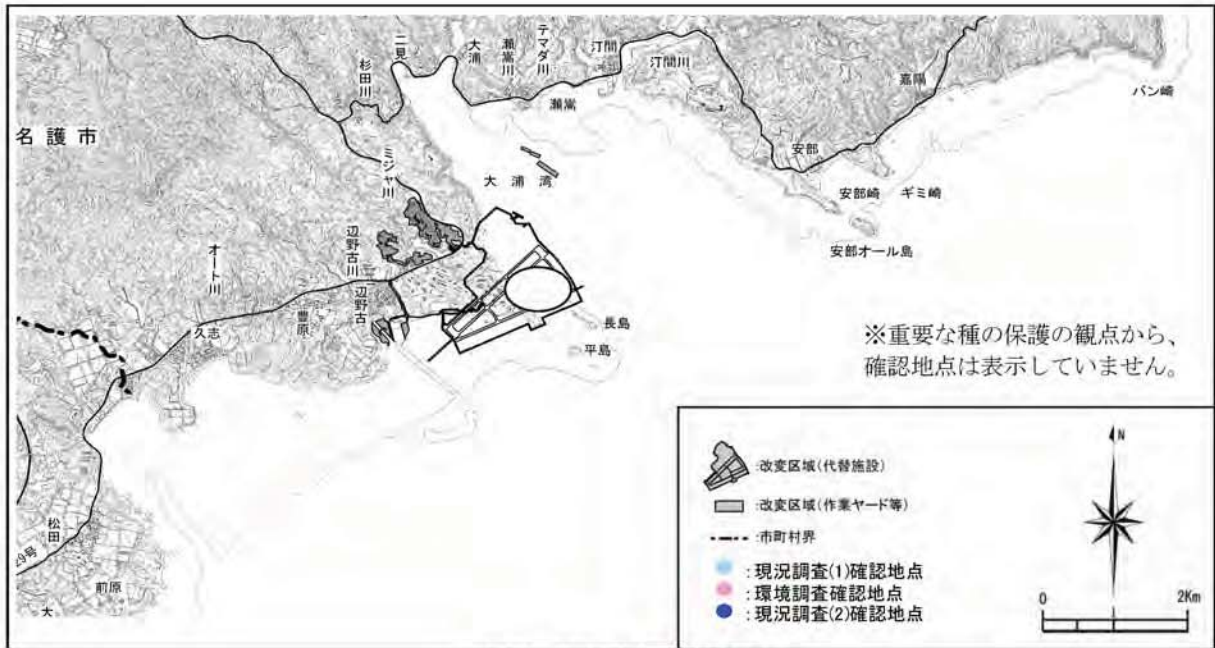
コベソコミミガイの確認地点