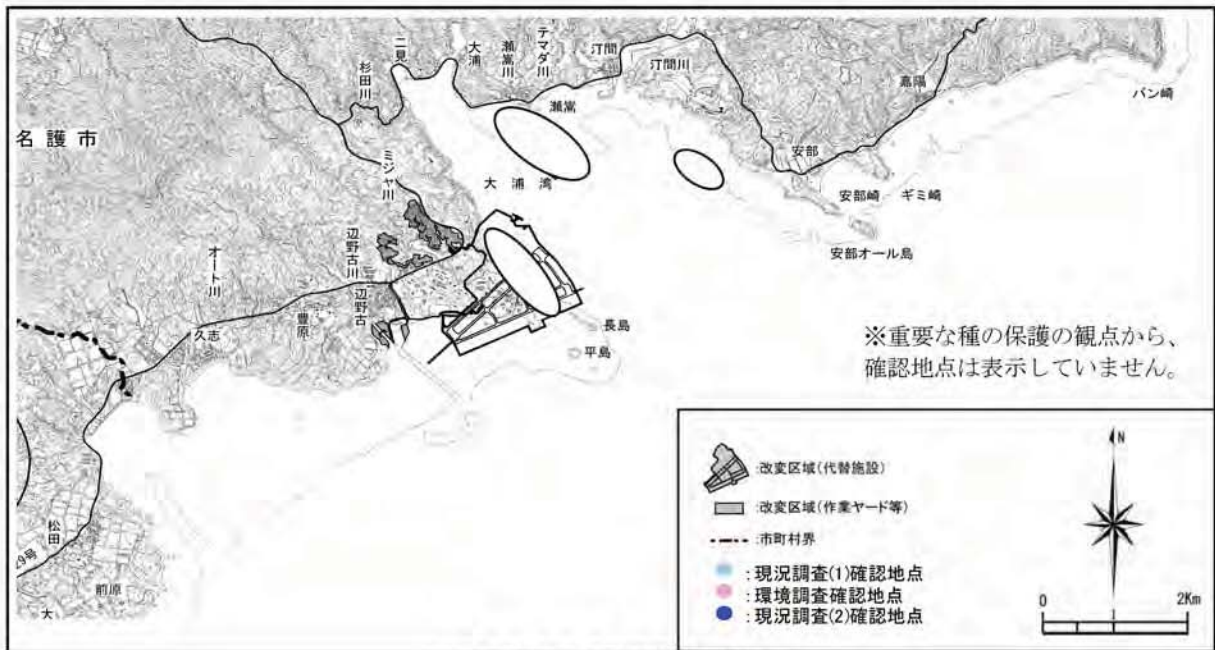
ニライカナイゴウナの確認地点