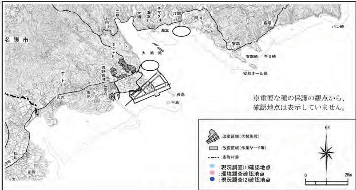
カエタケの確認地点