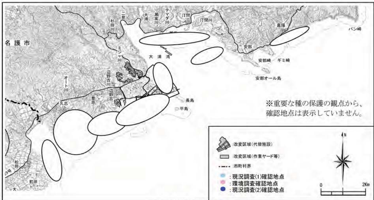
ソメワケグリの確認地点