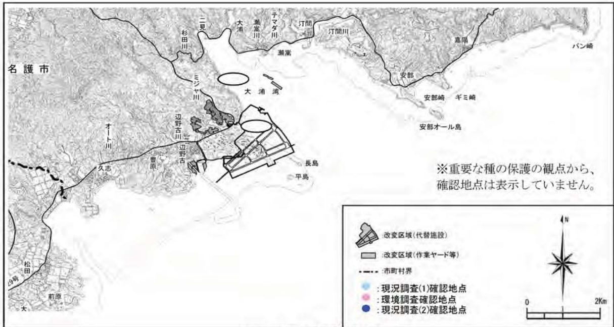
イシワリマクラの確認地点