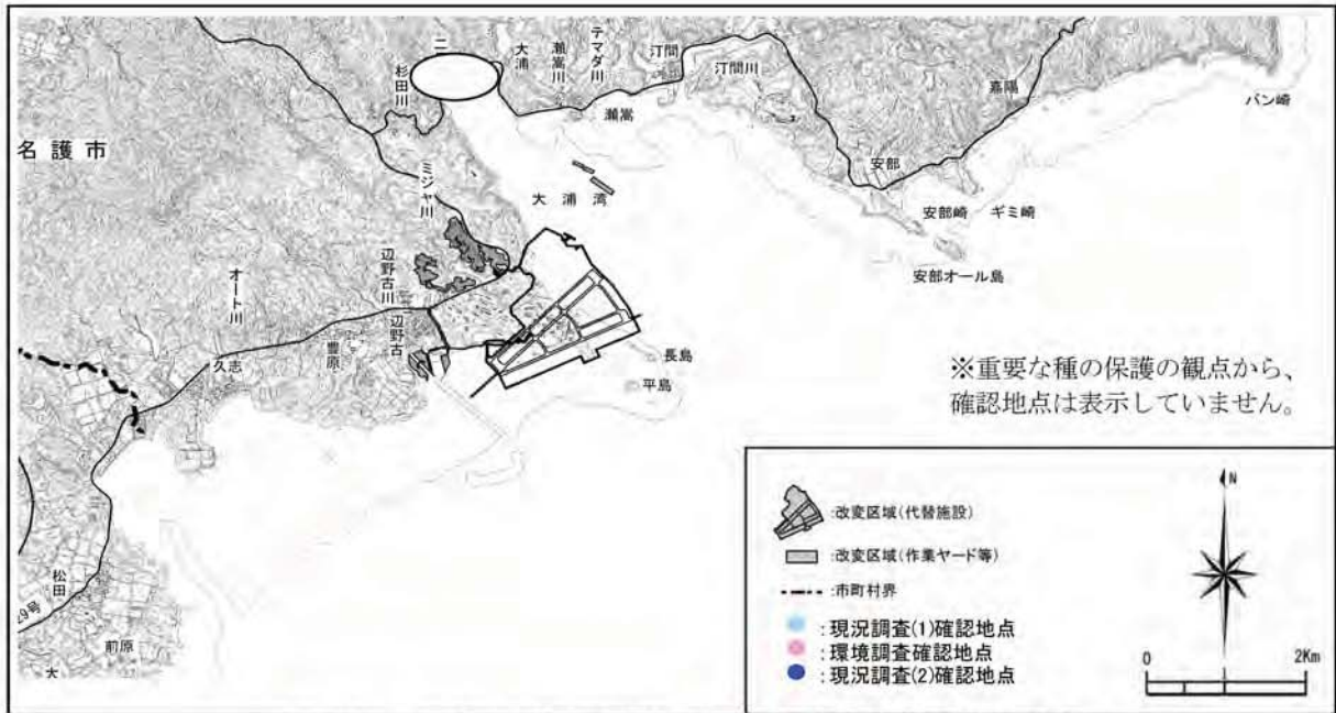
キヌメハマシノミガイ (トリコハマシノミガイ) の確認地点