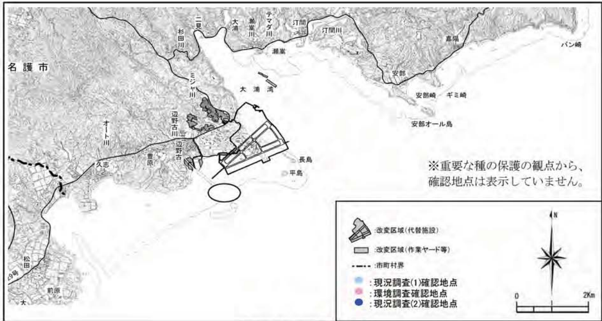
カヤノミガイの確認地点