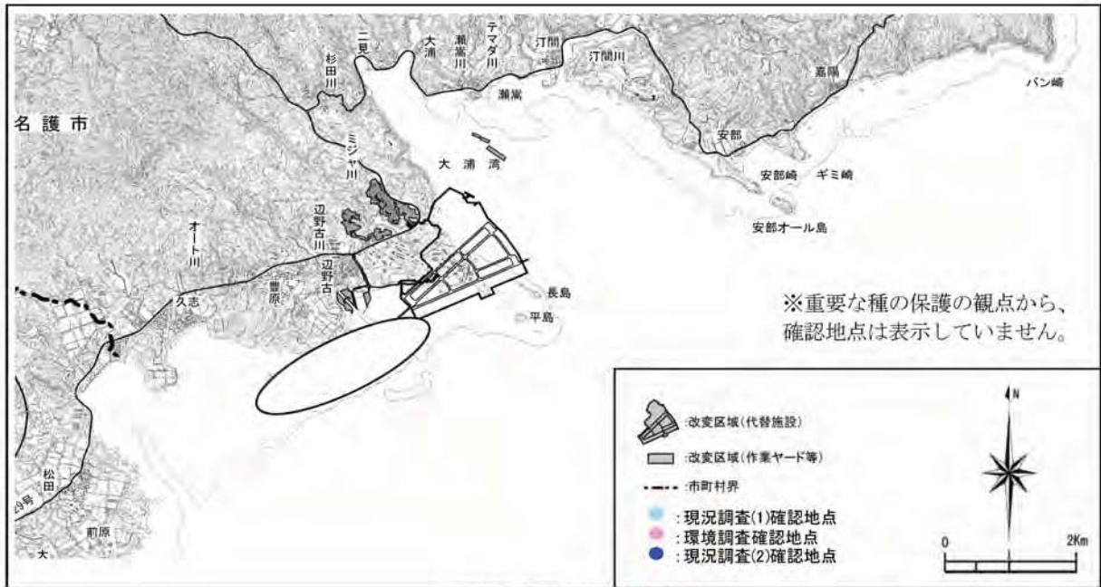
ウチワガイの確認地点