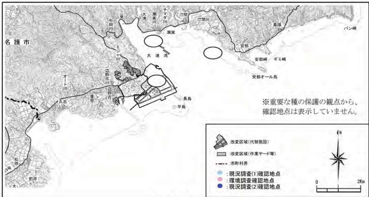
シチクガイの確認地点