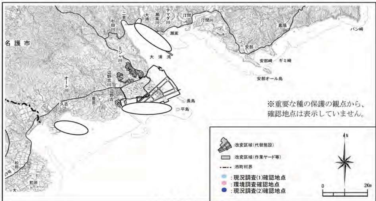
ハボウキガイの確認地点