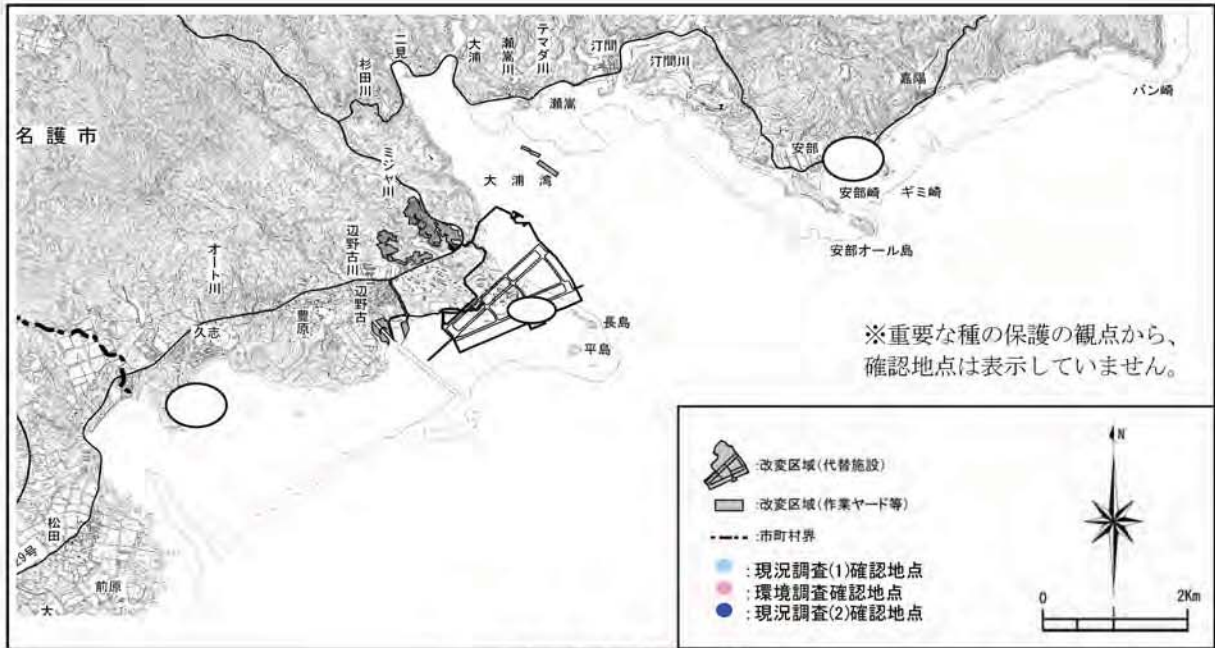
リュウキュウムシロの確認地点