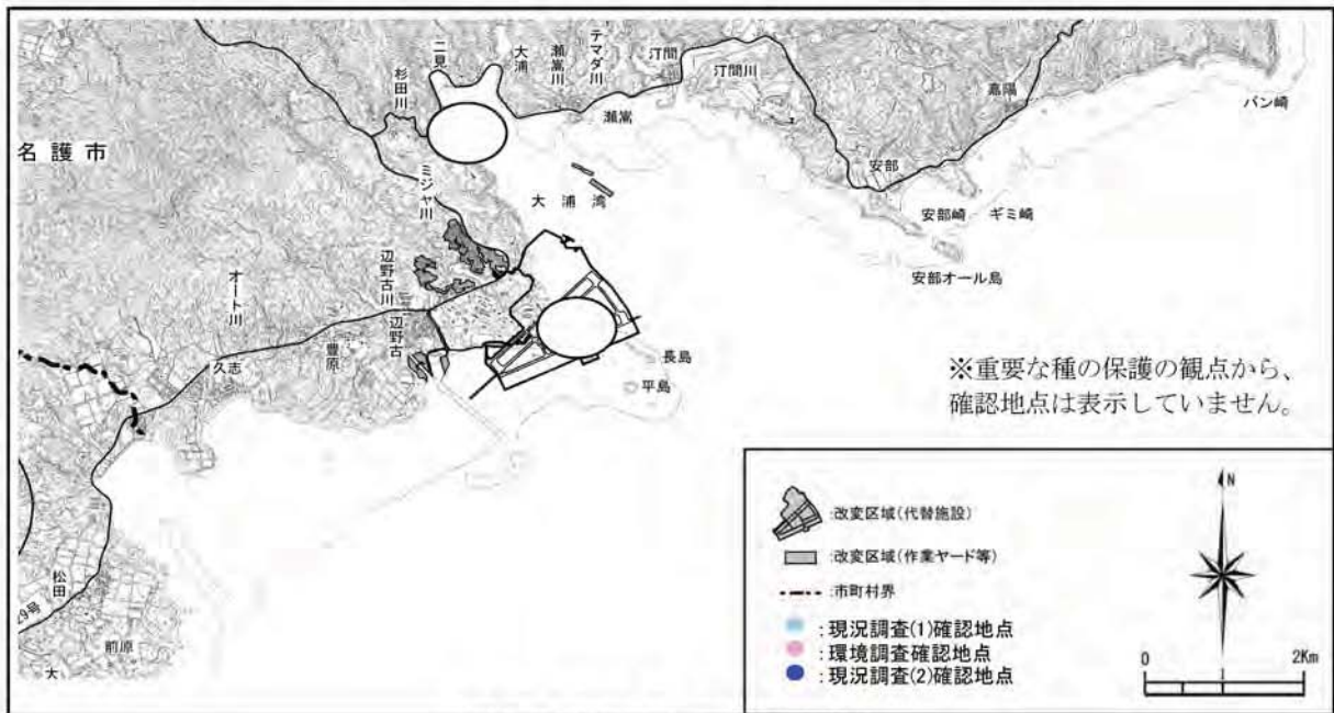
フトスジムカシタモトの確認地点