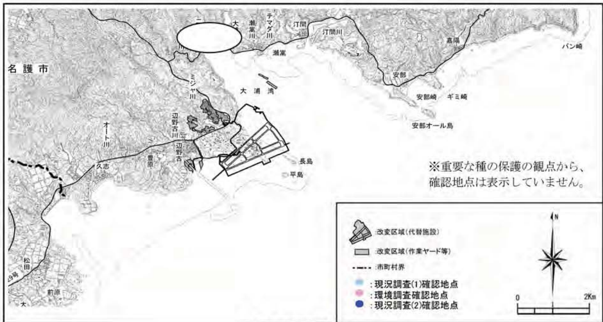
カワアイの確認地点