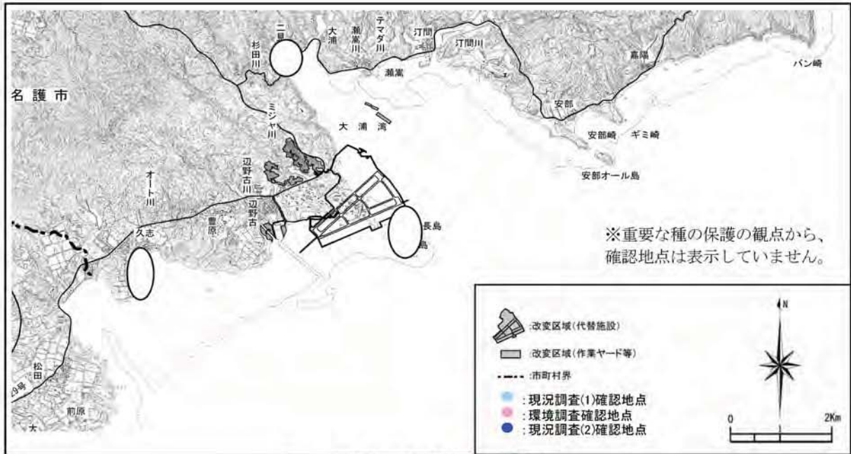
ヨウラクレイシダマシの確認地点