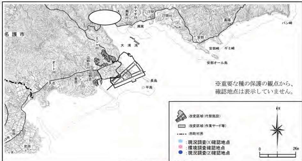
マドモチウミニナの確認地点