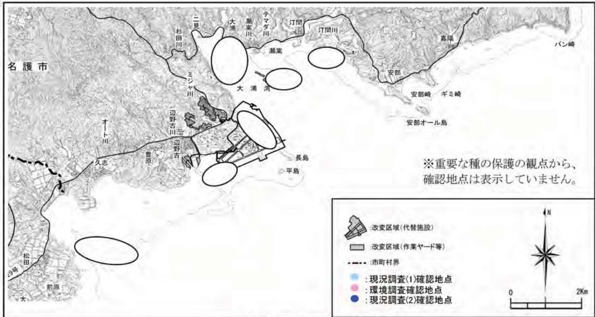
カシパンヤドリニナの確認地点