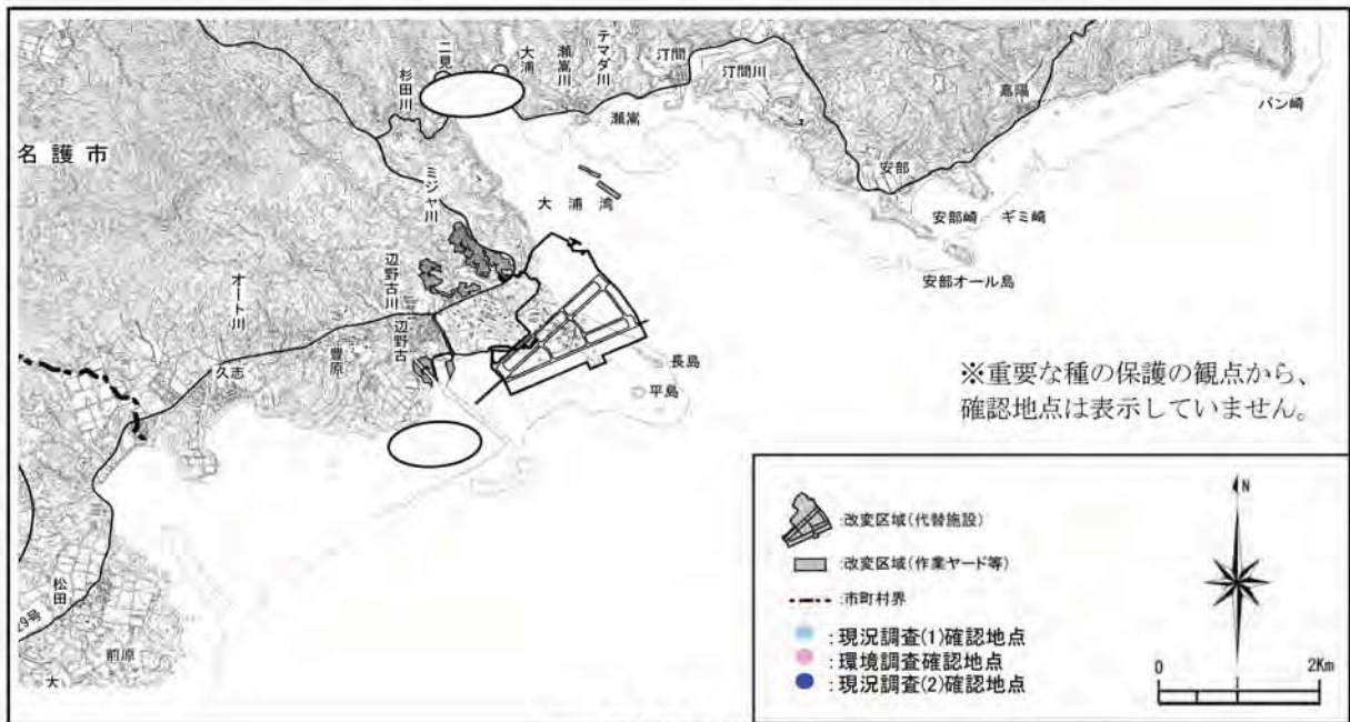
ツツミガイの確認地点