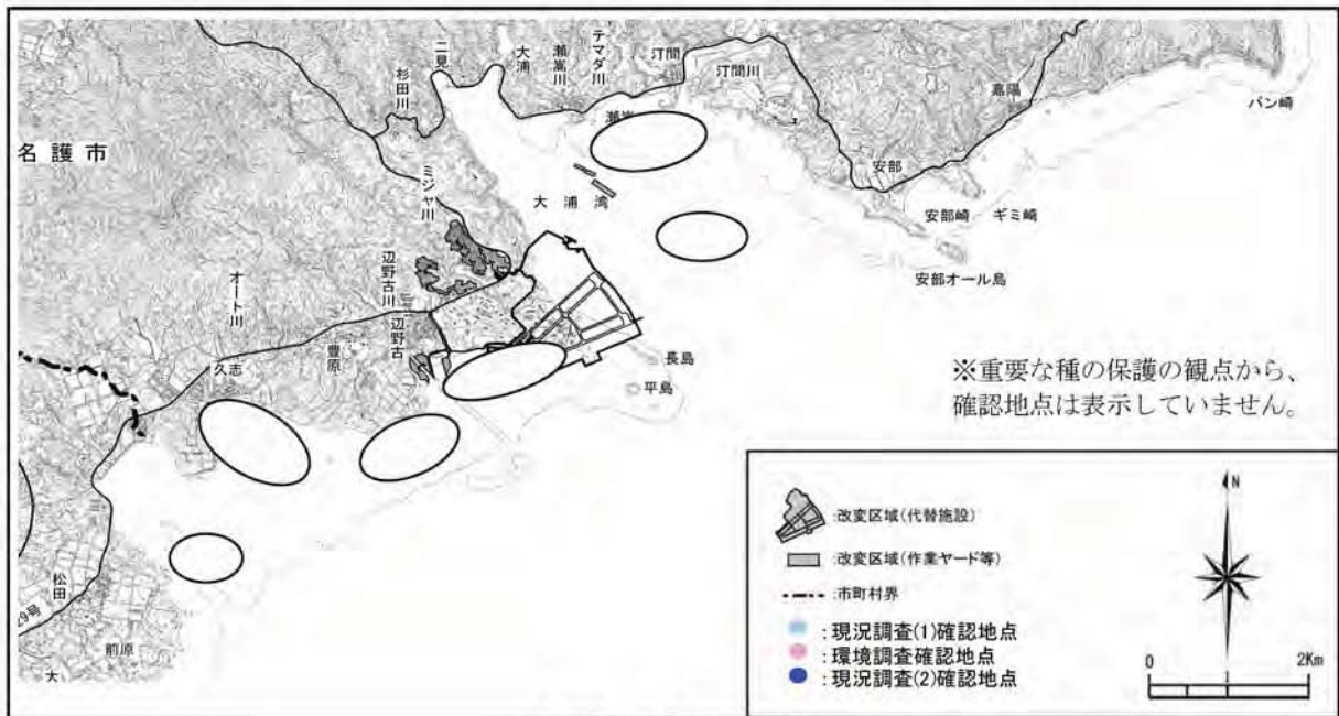
アラゴマフダマの確認地点