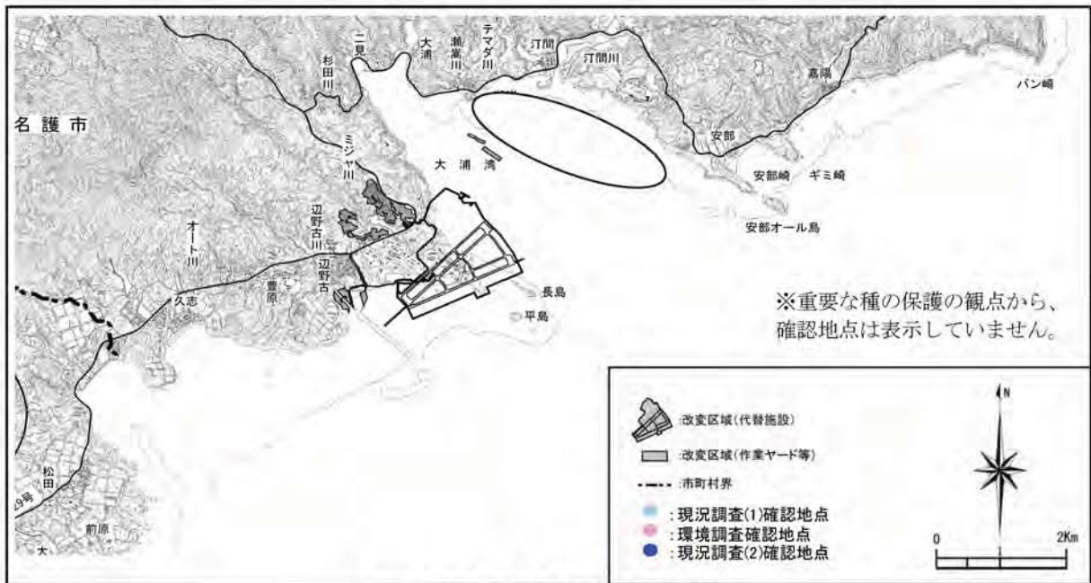
ヒメツメタガイ沖縄型の確認地点