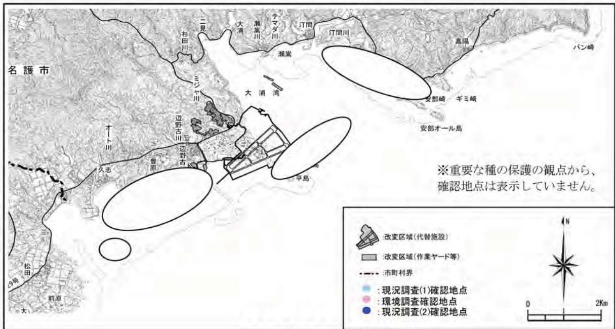
マルシロネズミの確認地点