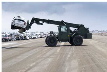
米軍による仙台空港復旧作業 (東日本大震災)