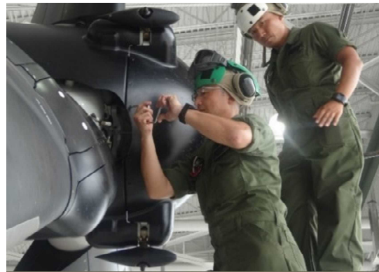
機体の点検・整備