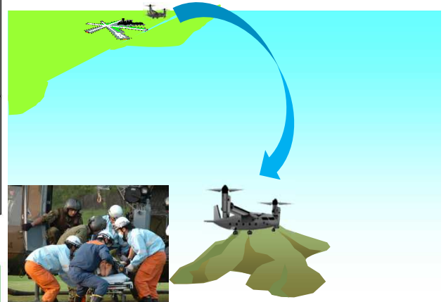
飛行場のない離島でも離着陸可能