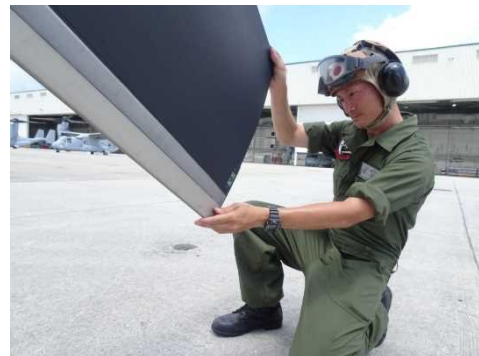
機体の到着、受入点検(令和2年7月上旬～)