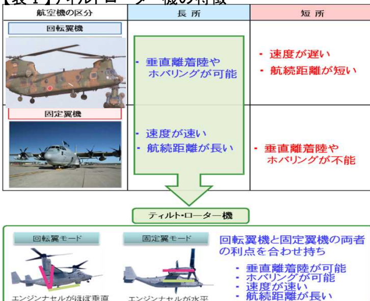
【表Ⅰ】ティルトローター機の特徴