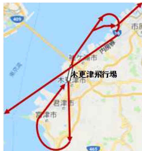
航空路誌に示す 離着陸経路（イメージ）