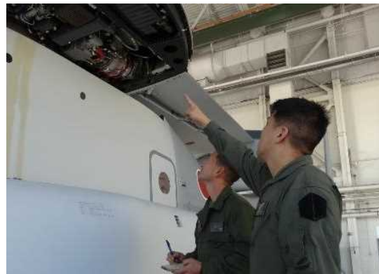
教育訓練による人材育成