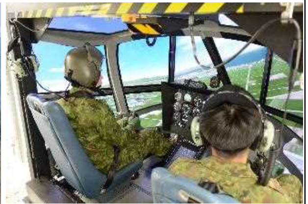
シミュレータ訓練