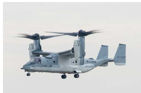
飛行開始(令和2年11月6日以降)