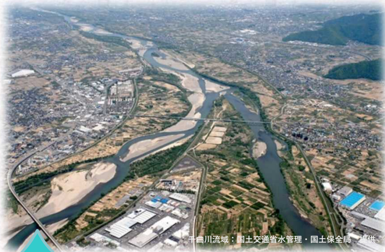
千曲川流域