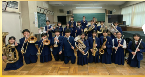
昭島市立瑞雲中学校吹奏楽部 Akishima City Zuiun Junior High School Wind Ensemble