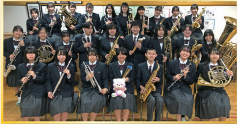
昭島市立拝島中学校吹奏楽部 Akishima City Haijima Junior High School Wind Ensemble