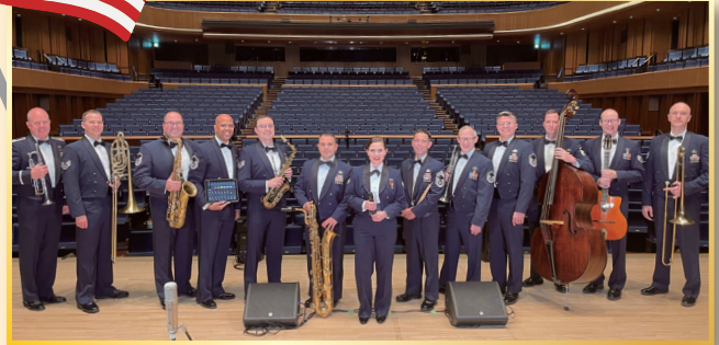
米国空軍太平洋音楽隊 United States Air Force Band of the Pacific