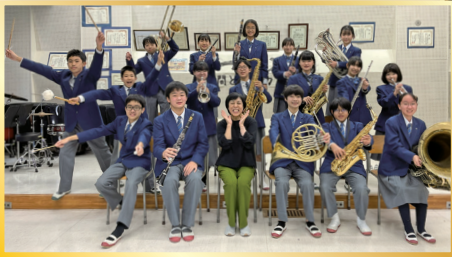
福生市立福生第三中学校吹奏楽部 Fussa City Fussa 3rd Junior High School Wind Ensemble