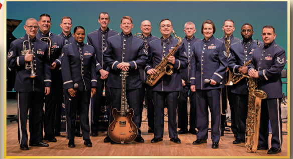
米国防空軍太平洋音楽隊 United States Air Force Band of the Pacific