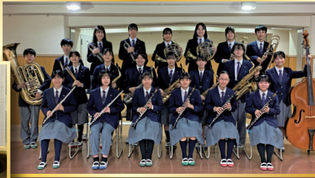
福生市立福生第二中学校吹奏楽部 Fussa City Fussa 2nd Junior High School Wind Ensemble