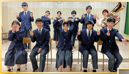
福生市立福生第一中学校吹奏楽部 Fussa City Fussa 1st Junior High School Wind Ensemble

Free of charge with advance application 定員1,000名 Maximum capacity: 1,000