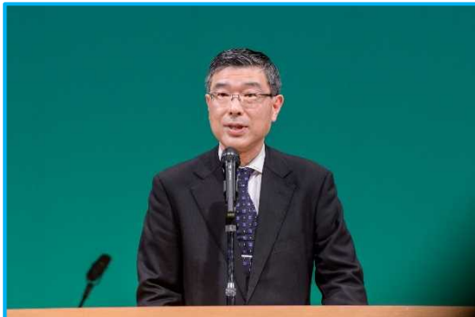
北関東防衛局次長 挨拶