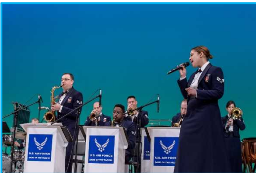
米国空軍太平洋音楽隊⑤