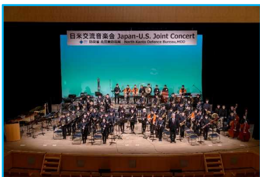
集合写真 羽村第一中学校吹奏楽部