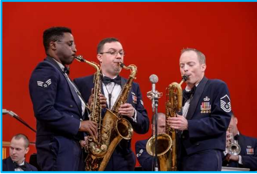
米国空軍太平洋音楽隊③