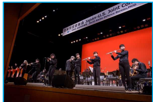
羽村第一中学校吹奏楽部④