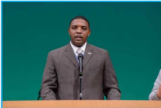
第374空輸航空団司令官 挨拶