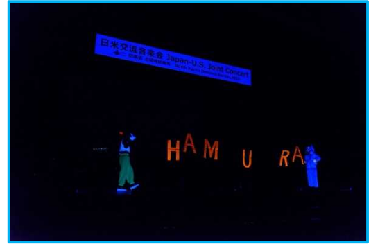
羽村第一中学校吹奏楽部⑥