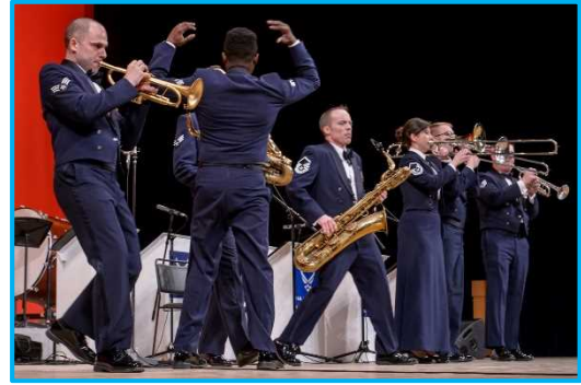
米国空軍太平洋音楽隊④