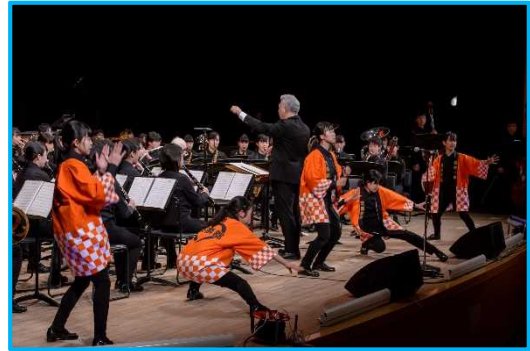
羽村第一中学校吹奏楽部②