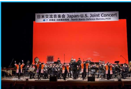
羽村第一中学校吹奏楽部①