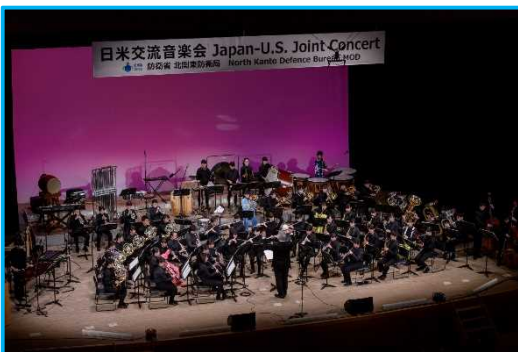
羽村第一中学校吹奏楽部③