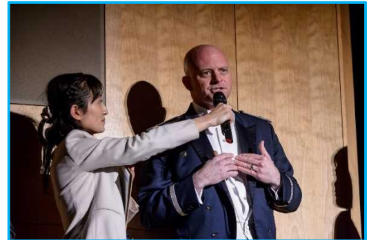
代表者インタビュー②