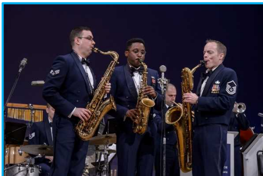
米国空軍太平洋音楽隊①