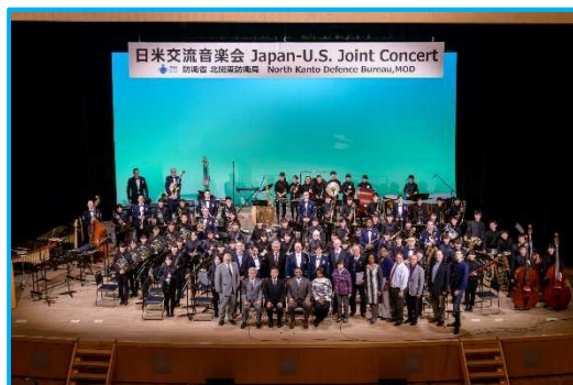
集合写真 日米の参加団体