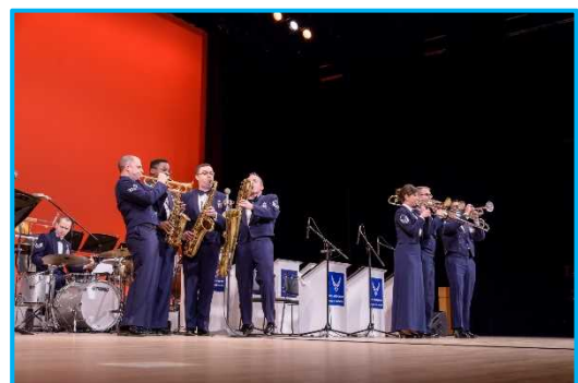
米国空軍太平洋音楽隊②