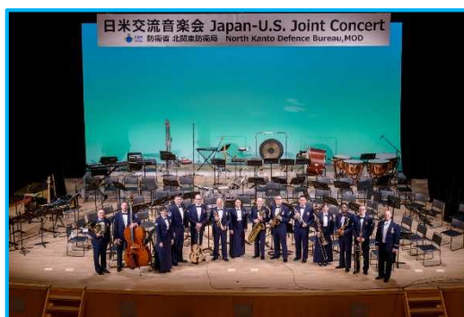
集合写真 米国空軍太平洋音楽隊