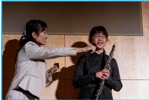
代表者インタビュー①