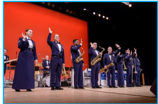
米国空軍太平洋音楽隊⑥