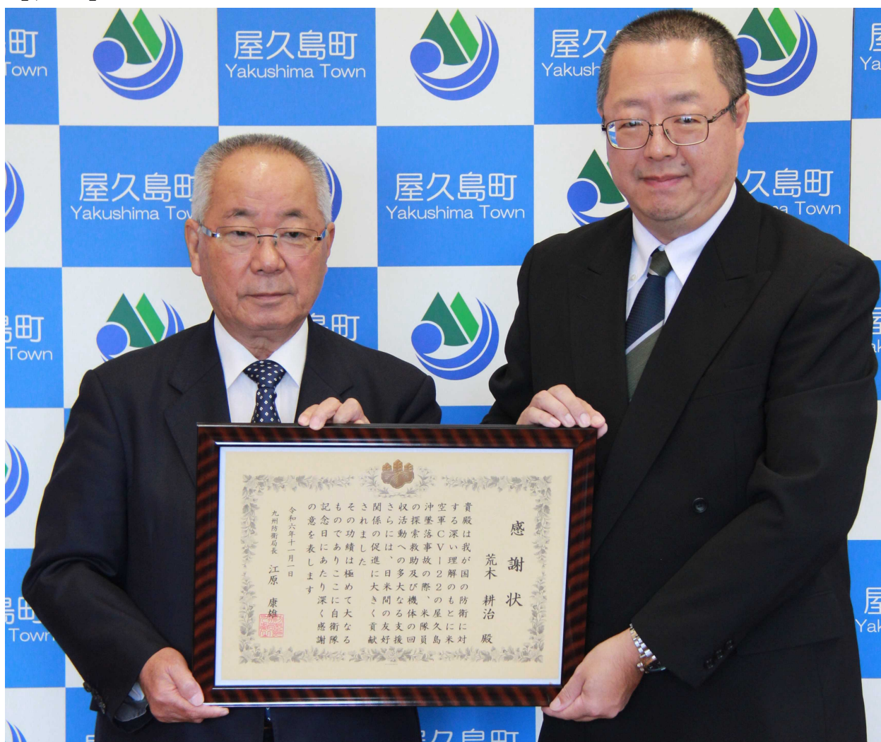
▲屋久島町長 荒木耕治氏（左）

※ 米空軍所属オスプレイの事故発生直後から荒木氏は、捜索救助・回収活動を行う米軍及び自衛隊に対し、現地連絡所の提供や、町職員を派遣し、必要な機材等を調達するなど、各種支援について大きく貢献されました。更に、米軍と地元住民との交流の機会を設け、住民による協力活動の輪が広まり捜索活動等の協力に大きく貢献されました（右は、江原九州防衛局長）