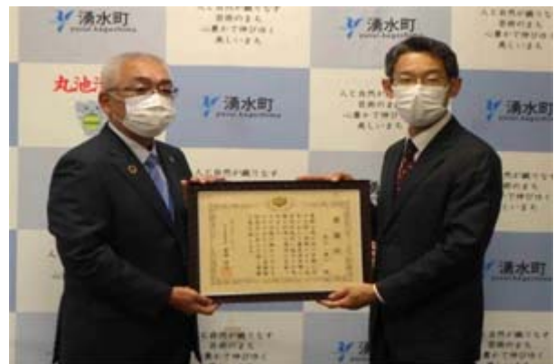
▲池上湧水町長（左）と玉越企画部長