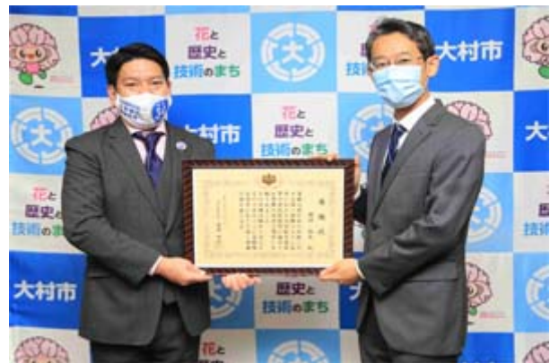
▲園田大村市長（左）と玉越企画部長