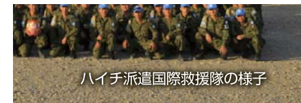
ハイチ派遣国際救援隊の様子