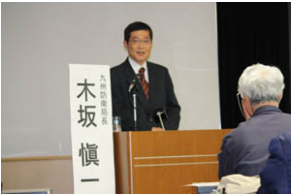
講演前に挨拶する木坂慎一九州防衛局長