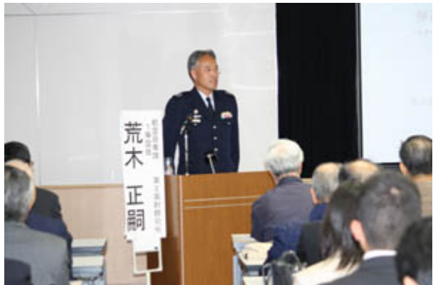
講演する航空自衛隊第2高射群司令 荒木正嗣1等空佐