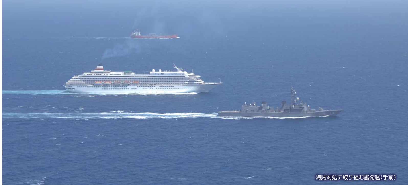
海賊対処に取り組む護衛艦(手前)