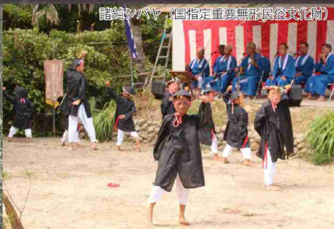
諸鈍シバヤ (国指定重要無形民俗文化財)