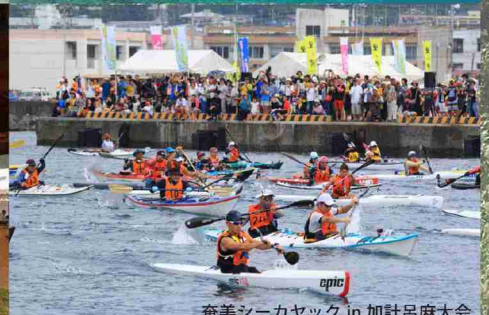
奄美シーカヤック in 加計呂麻大会