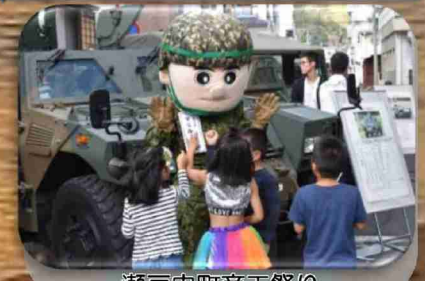
瀬戸内町商工祭り