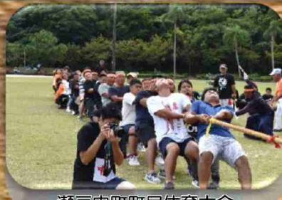
瀬戸内町町民体育大会