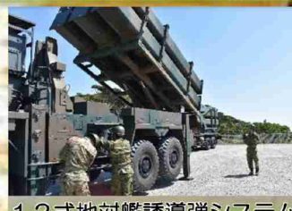
122式地对艦誘導弾システム