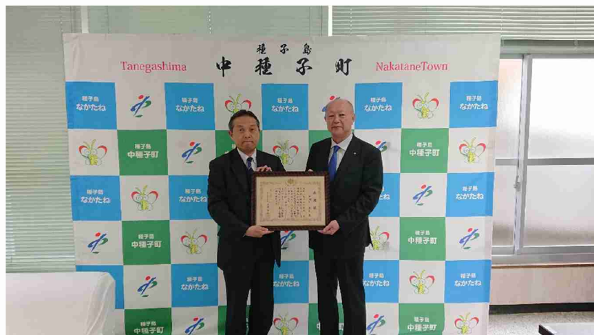
▲池田企画部次長(左)と田淵川町長(右)

今回の感謝状は、田淵川町長のこれまでの努力や御功績に対し、当局の深い感謝の意を表すものです。