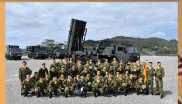
第301地对艦ミサイル中隊