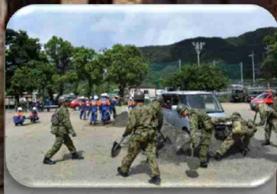
瀬戸内町防災訓練