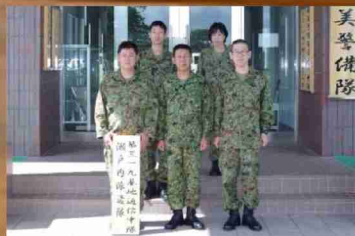
第319基地通信中隊 瀬戸内派遣隊