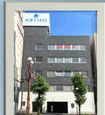
鹿児島防衛事務所

鹿児島市加治屋町13-4 MAX加治屋町ビル(5F) TEL:099-219-9055