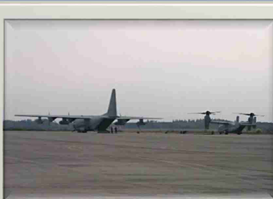
KC-130地上給油訓練(鹿屋航空基地)