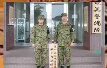
第135地区警務隊 瀬戸内連絡班