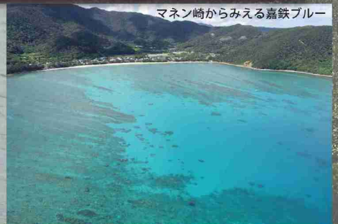
マネン崎からみえる嘉鉄ブルー