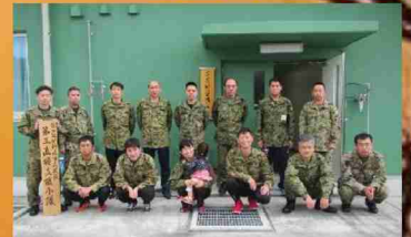
第101特科直接支援小隊 第3直接支援小隊