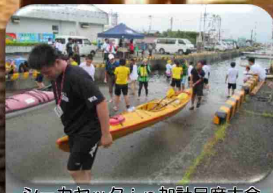
シーカヤック in 加計呂麻大会 (ボランティア活動)