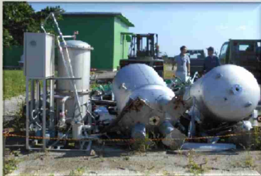
施設発生材の管理(沖永良部島分屯基地)

主な業務としては、自衛隊施設に係る周辺対策事業、防衛問題セミナーの開催などの地方協力確保事務、建設工事、施設の取得等のための関係機関等との連絡・調整等を行っておりますが、管轄内では、令和元年度から実施している米軍岩国基地所属KC-130空中給油機の鹿屋航空基地へのローテーション展開や島しょ部等における防衛力強化のための日米共同訓練なども行われており、必要に応じてその支援を行っております。