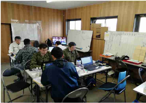
▲現地連絡所の様子

九州防衛局としては、訓練の実施に当たっては、地元自治体、周辺住民の方々の御理解と御協力が不可欠であると考えており、今後とも地元自治体、周辺住民の方々の不安や懸念を解消すべく適切な情報提供等を行うなど誠心誠意努力してまいります。