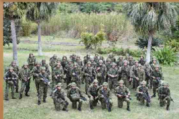
奄美警備隊普通科中隊