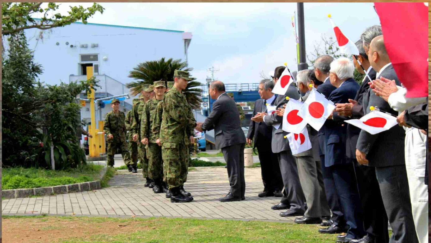
瀬戸内町歓迎セレモニー