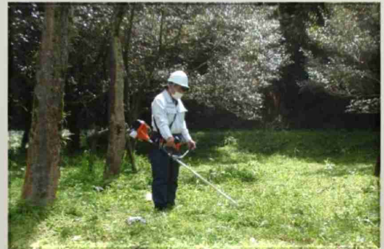
周辺財産の管理(鹿屋市)