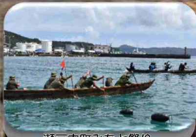
瀬戸内町みなと祭り