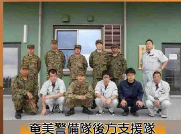
奄美警備隊後方支援隊