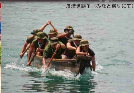
舟漕ぎ競争 (みなと祭りにて)