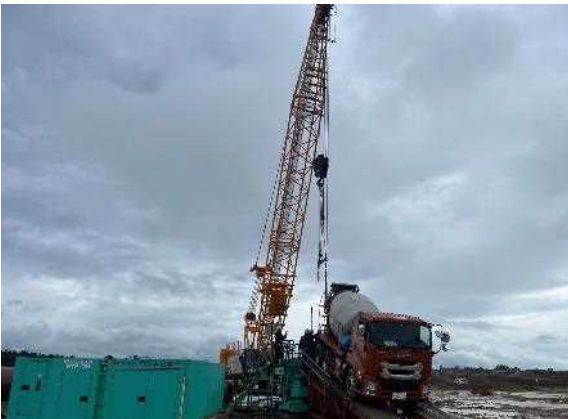
通信局舎 基礎工事