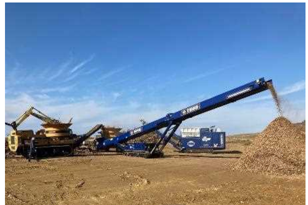
伐採樹木 破碎・チップ化