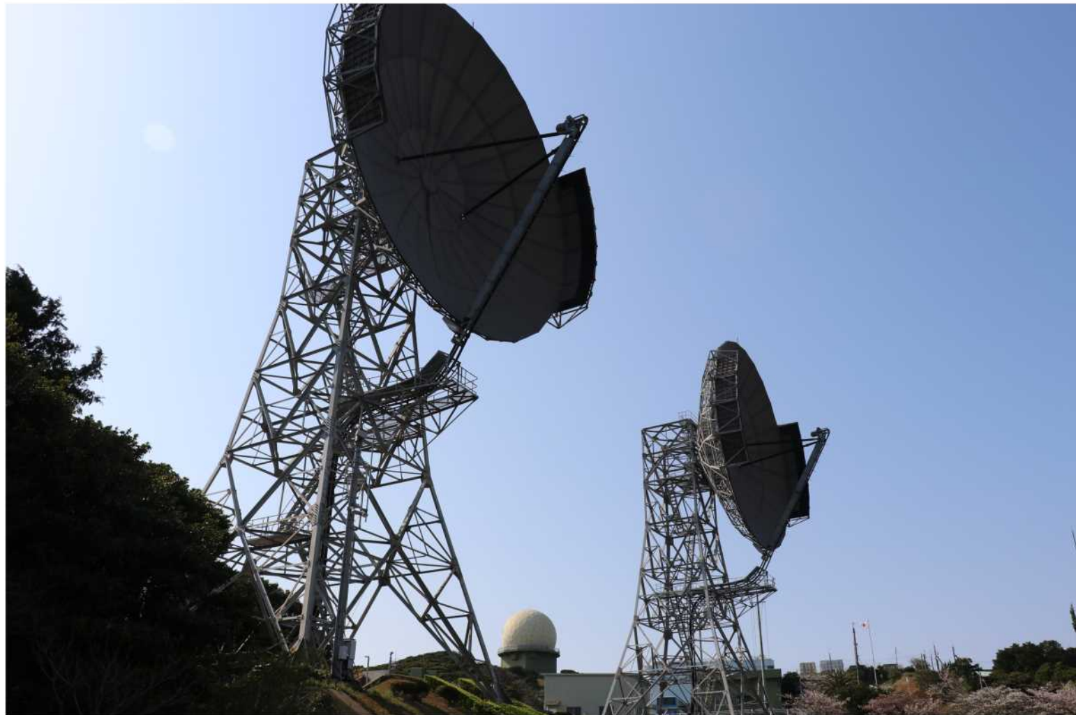
写真：福江島分屯基地のOHアンテナやレーダードーム等 (提供：航空自衛隊福江島分屯基地)