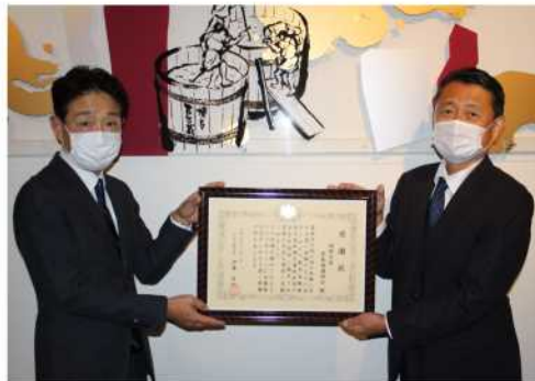
▲福岡空港発展協議組合 石蔵組合長（左）