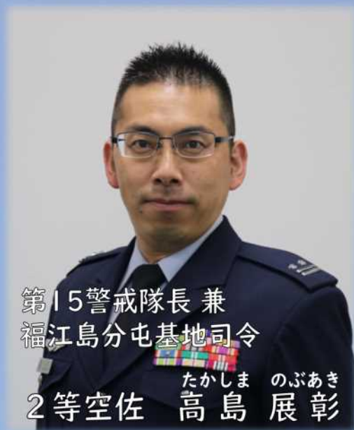
第15警戒隊長 兼 福江島分屯基地司令

福江島分屯基地は、昭和29年（1954年）に西部訓練航空警戒隊が警戒監視任務を開始し、今年で創立67周年を迎えます。これまで築いてきた地域の皆様との信頼関係を大切に、これも国民の皆様の安心・安全を守るため、尽力していきます。引き続きのご理解とご協力を賜りますよう宜しくお願い申し上げます。