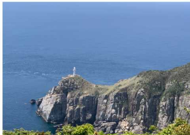
写真：五島市大瀬崎 (提供：航空自衛隊福江島分屯基地)