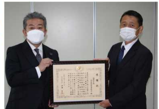
▲福岡空港用地保有者組合 藤本組合長（左）