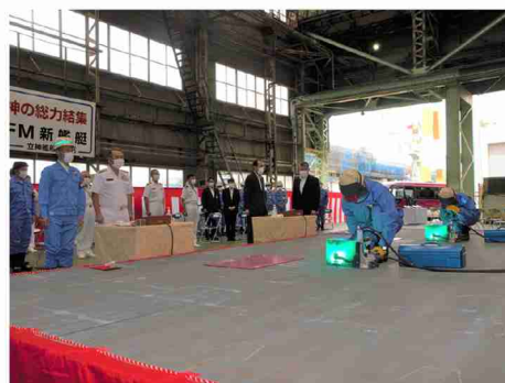
▲溶接開始(起工の儀)