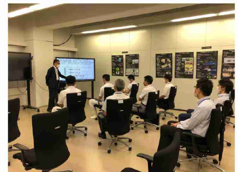
▲リモート起工式(三菱重工業横浜製作所)の様子