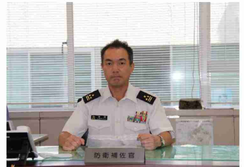
防衛補佐官 1等陸佐 村岡 史朗

8月5日付で長崎防衛支局長を拝命致しました三原です。 当支局は、九州地区を中心に艦艇、魚雷等の装備品及び弾火薬類等の調達にかかる監督・検査、原価監査などを担任しており、品質・安全・納期をスローガンに活動しております。 高品質の装備品を着実に調達できるよう、支局一丸となって努力してまいります。 宜しくお願ひ致します。