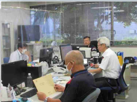
執務室内での様子

また、当事務所管内では、今年度、航空自衛隊新田原基地での米軍の緊急時使用に係る施設整備が始まる予定です。何よりも地域に着した事務所として関係地方自治体等とのパイプ役として、職員一丸となって業務に取り組んで参る所存です。