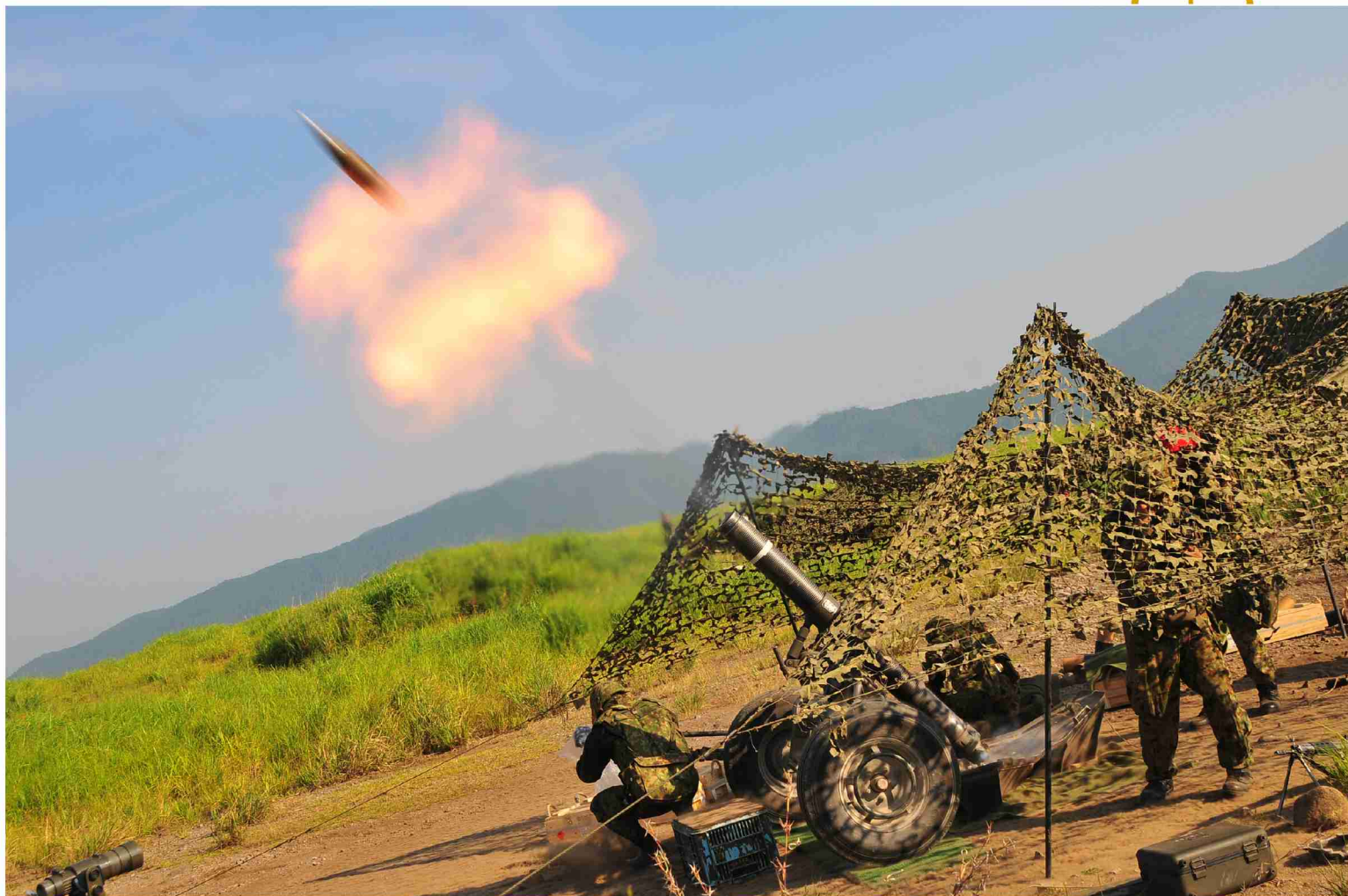
写真：迫撃砲射撃訓練の様子