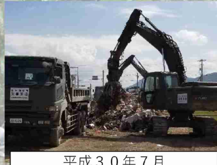
平成30年7月 西日本豪雨災害派遣