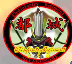
都城駐屯地 准曹士 シンボルマーク