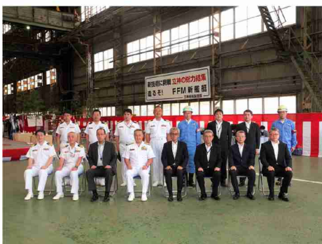
▲O1FFM 起工式での集合写真

なお、3番艦は令和3年1月からドック内でブロック搭載、6月頃に進水し、令和4年12月頃に引渡。4番艦も同様に令和5年3月頃に引渡となる予定です。