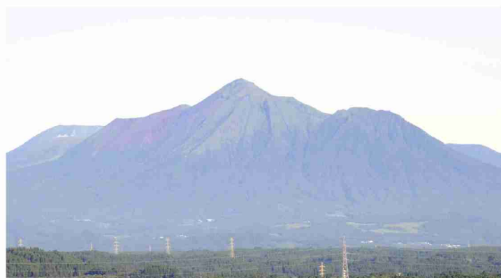
写真：霧島連山