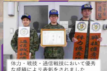
体力・戦技・通信戦技において優秀な成績により表彰をされました