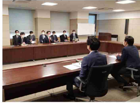
▲山口佐賀県知事(手前右側)を訪問