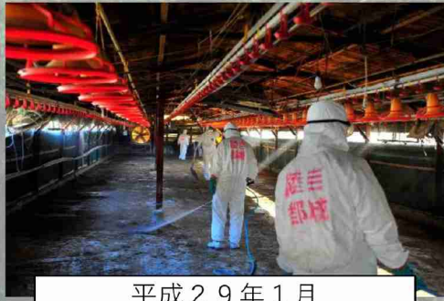
平成29年1月 鳥インフルエンザ災害派遣