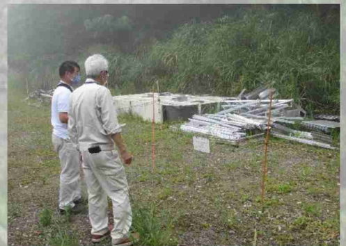
施設発生材の現場確認