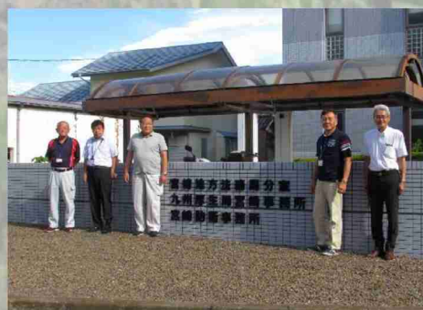
少数精鋭で頑張ってます！！