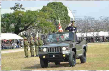
駐屯地創立記念行事