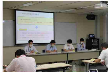
▲説明を行う当局職員