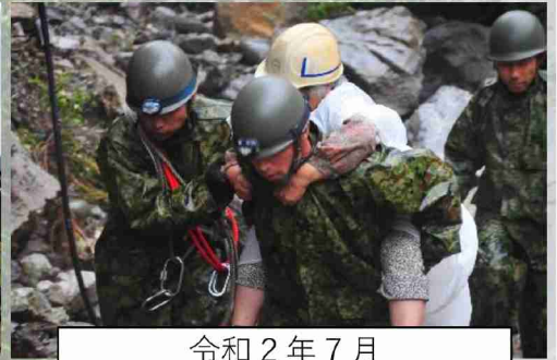
令和2年7月 令和2年7月豪雨災害派遣