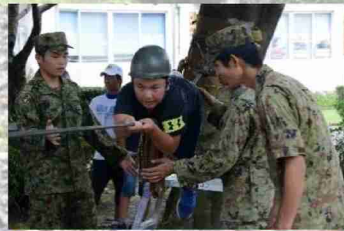
夏休みちびっ子大会