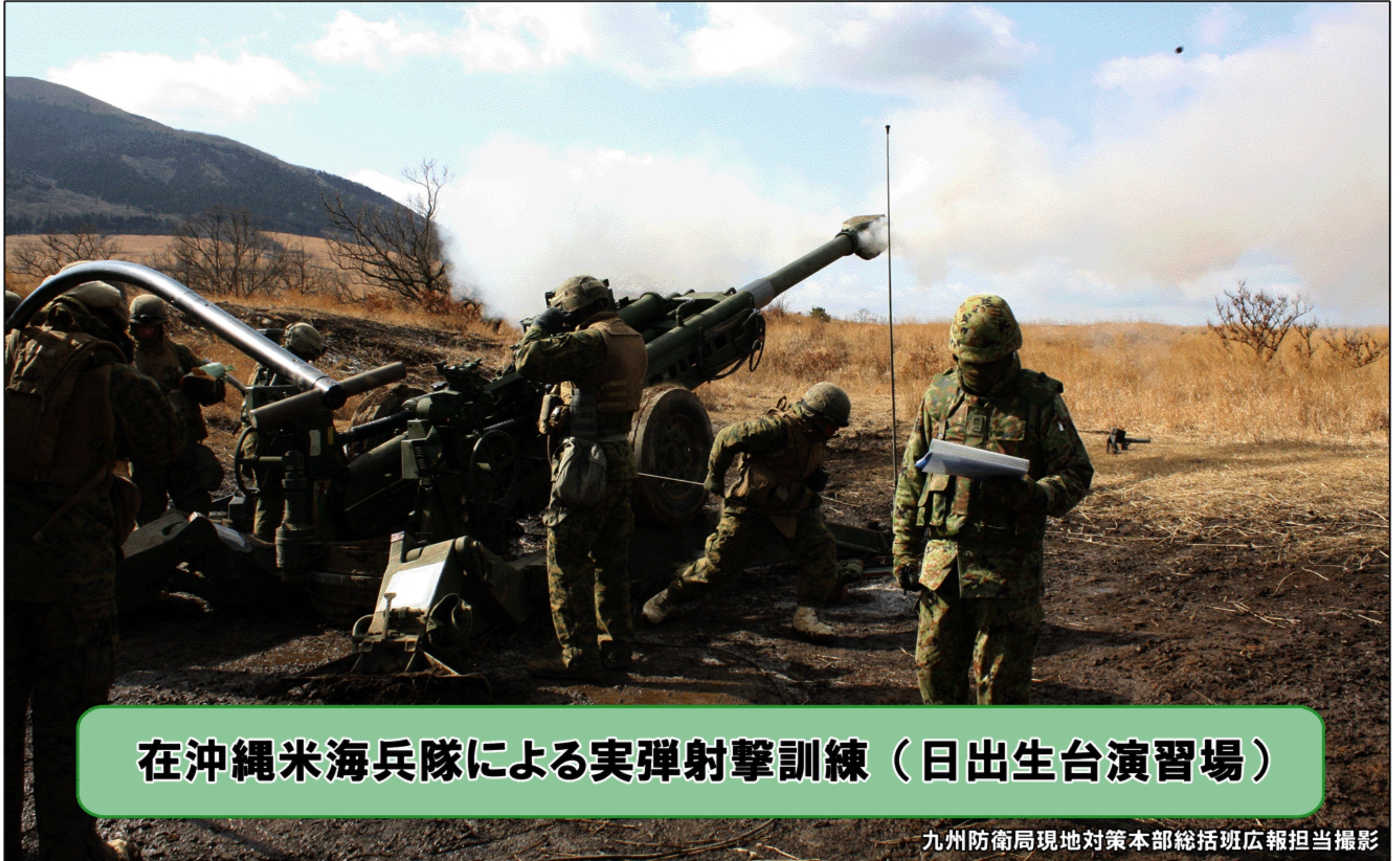
在沖縄米海兵隊による実弾射撃訓練（日出生台演習場）

福岡市博多区博多駅東 2丁目10-7 福岡第2合同庁舎内 092-483-8811