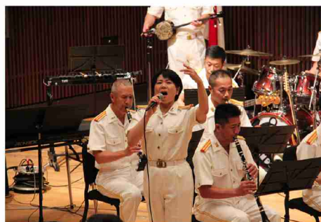
▲深海2曹による歌唱