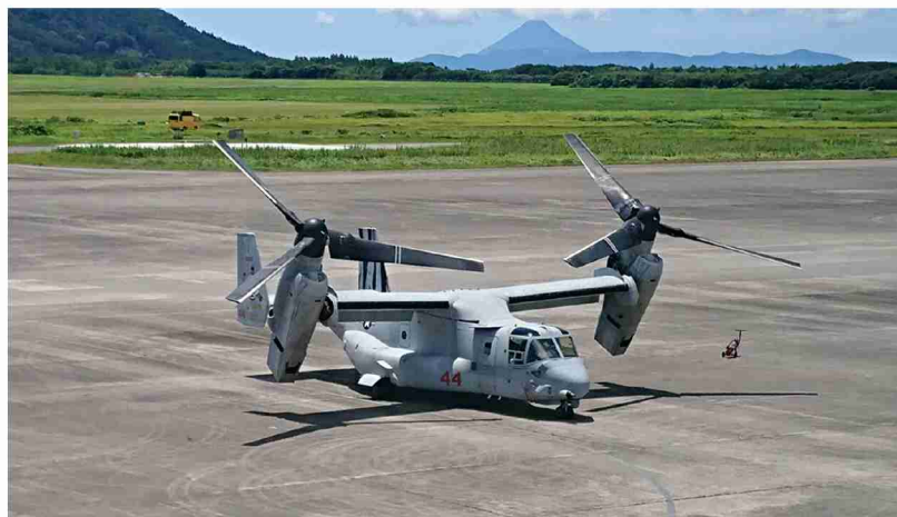
▲駐機しているオスプレイ

九州防衛局では不測の事態に対応するため、夜間・休日を問わず連絡体制を確保しております。