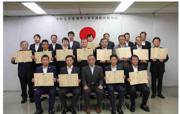
▲【上段左から】設備課長、建築課長、調達部次長、(株)大三洋行九州支社、調達計画課長、土木課長、事業監理課長 【中段左から】(株)梅村組、(株)大同工務店、(株)興南商工、(株)今村組、(株)浅川組九州営業所、(株)川邊組、東亜建設工業(株)九州支店、栄城設備工業(株) 【前段左から】(株)上山建設、(株)サカヒラ、調達部長、伸和建設(株)、(株)西海建設