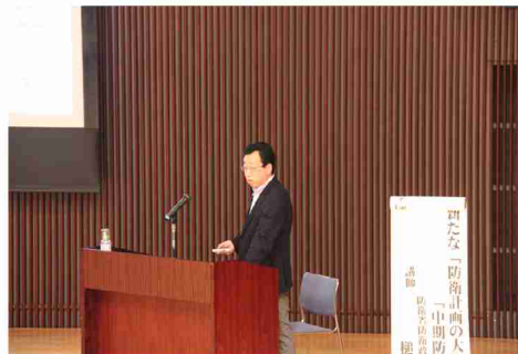
▲講演を行う樋道防衛政策局長