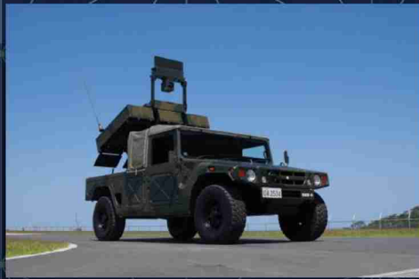
中距離多目的誘導弾(中多)