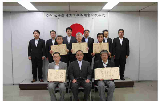
▲【上段左から】設備課長、建築課長、調達部次長、調達計画課長、土木課長、事業監理課長 【中段左から】(株)ドラムエンジニアリング、(株)協和コンサルタンツ九州支社、扇精光コンサルタンツ(株) 【前段左から】(株)泉創建エンジニアリング福岡事務所、調達部長、日本工営(株)福岡支店