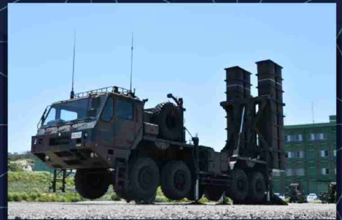
O3式中距離地对空誘導弾(中SAM)