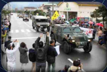
防衛協力諸団体による歓迎行事