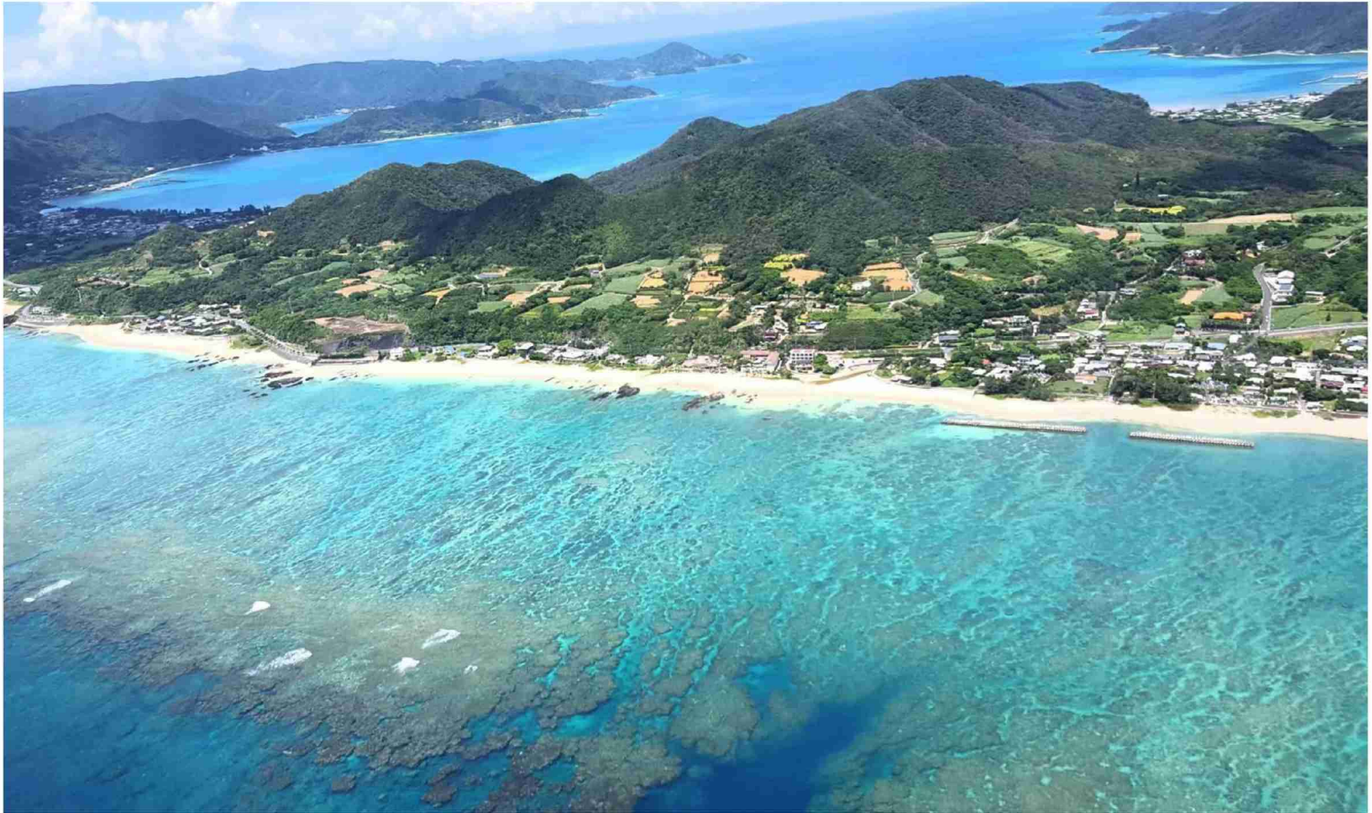
写真：奄美大島の海岸風景