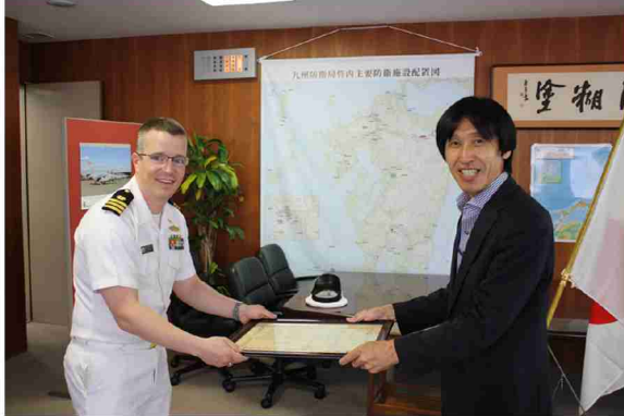
▲榭賀九州防衛局次長(右)から感謝状を受取るソレザー中佐(左)

ソレザー中佐は、平成28年4月着任以来、日本側の事情をよく理解し、積極的な対応に努め、基地関係諸問題の円滑かつ安定的な解決に尽力されました。ソレザー中佐は離任後、米国カリフォルニア州キャンプ・ペンドルトンにて勤務されます。