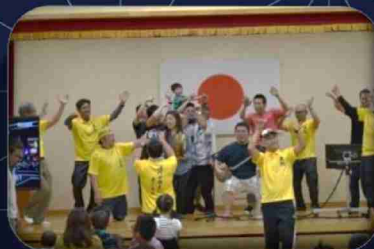
大熊町内会との交流会