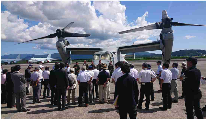
▲米軍からオスプレイについて説明を受ける参加者達

九州防衛局としては、市民の方々がオスプレイの機体を間近で確認して頂く、よい機会になったのではないかと受け止めており、引き続き、米側に対し、航空機の安全管理に万全を期すよう求めるとともに、市民の方々の御懸念や御不安を解消するため、引き続き、誠意をもって対応してまいります。