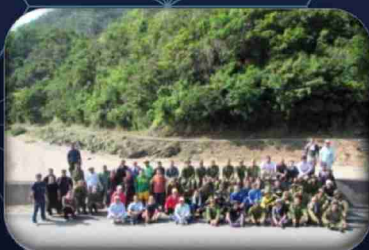
三月浜遊歩道草刈りボランティア