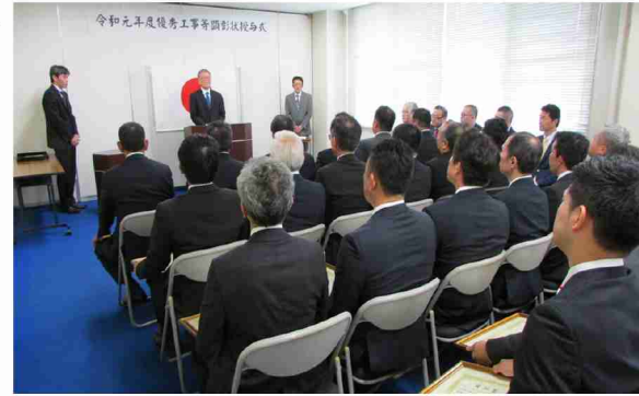
▲顕彰状授与式の様子

優秀工事等顕彰は、平成21年度に創設した制度です。熊本防衛支局が発注する建設工事並びに建設工事に付随する測量等の調査、設計及び監理などの業務に関し、工事等の目的物の出来形又は品質の優れているものであって、他の模範とするに、ふさわしいものを優秀工事等として選定し、顕彰する事により、入札参加者の受注意欲を高め工事目的物の品質確保を図る等、施設取得の円滑な推進に資することを目的としています。