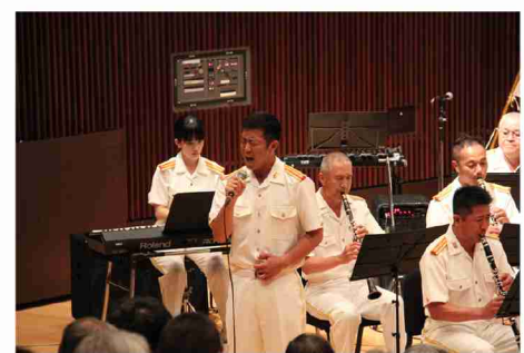
▲神宮司2曹による歌唱