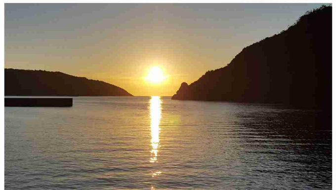
写真：奄美大島の夕日