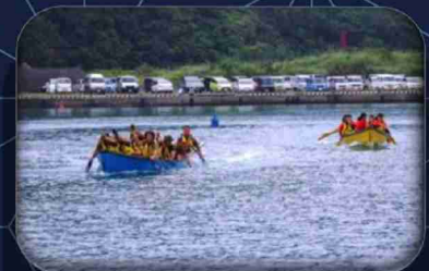
舟こぎ大会に出場(優勝)