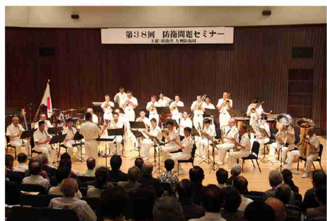
▲陸上自衛隊第8音楽隊による演奏