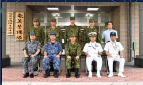
在奄美自衛隊指揮官会同 (陸・海・空の連携)