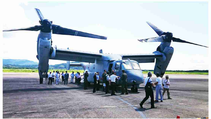
▲オスプレイの見学を行う参加者達