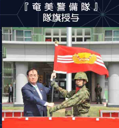
『奄美警備隊』 隊旗授与