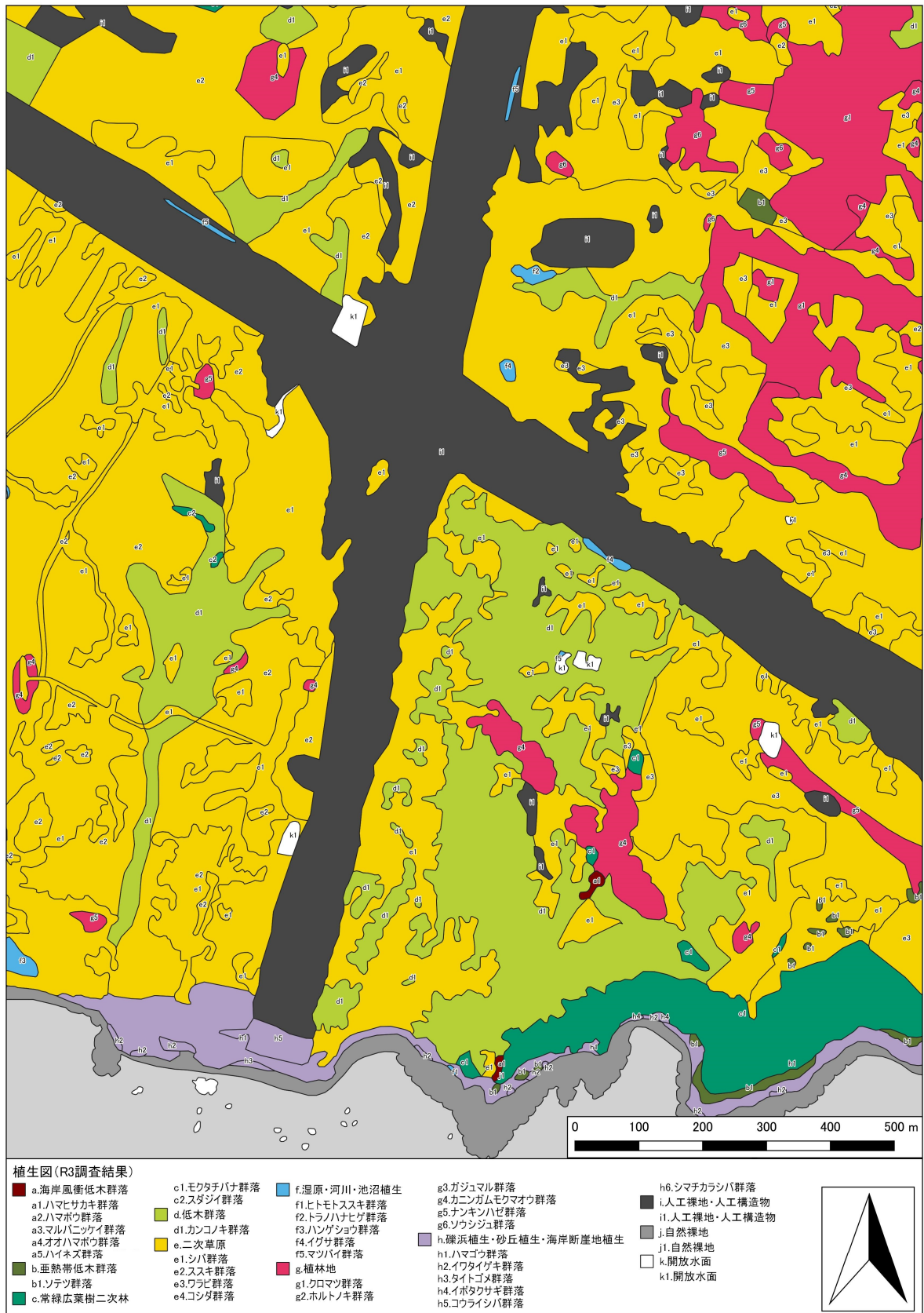
図-6. 13. 6 (5) 詳細植生図 (令和3年度)