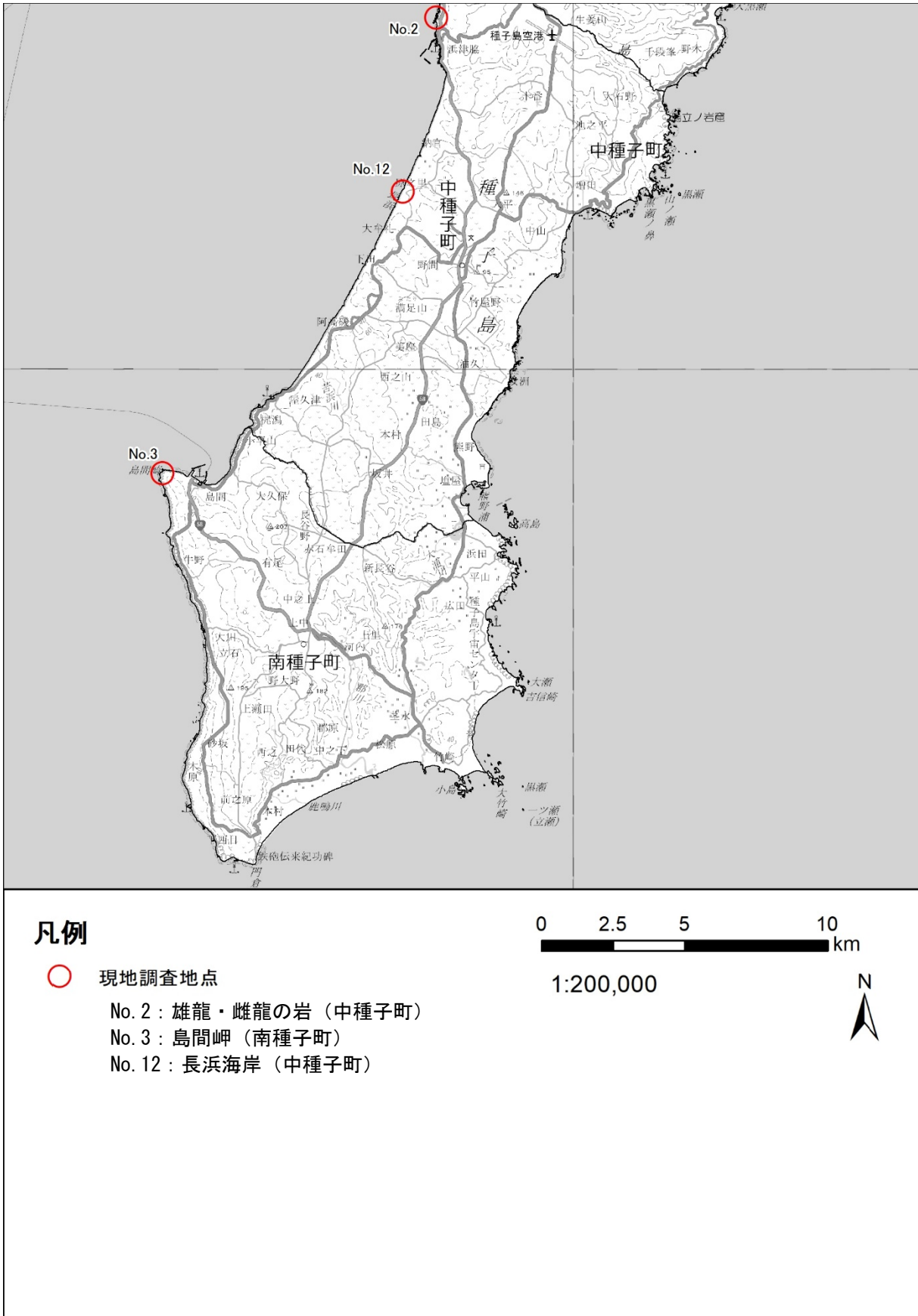
図-5. 2. 16(2) 景観調査地点