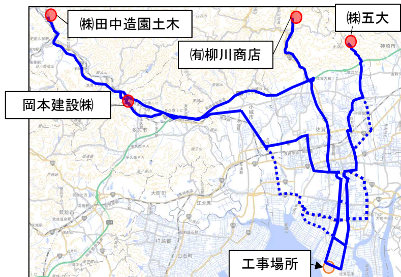
購入土の運搬ルート