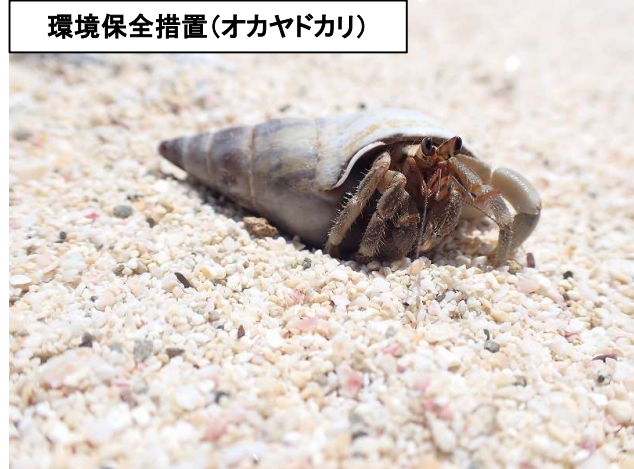
環境保全措置(オカヤドカリ)