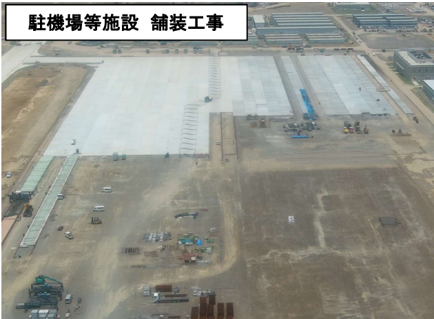
駐機場等施設 舗装工事