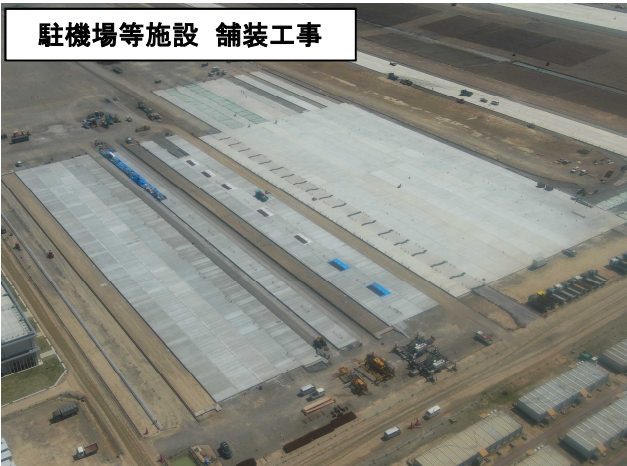
駐機場等施設 舗装工事