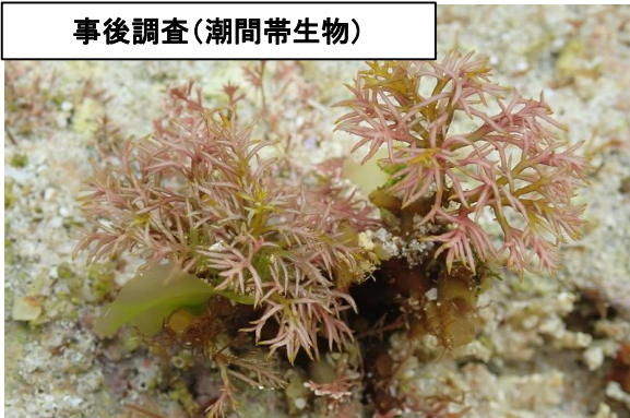
事後調査(潮間帯生物)