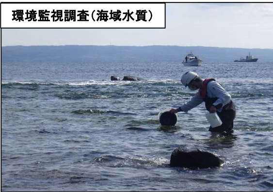
環境監視調査(海域水質)