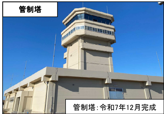
管制塔：令和7年12月完成