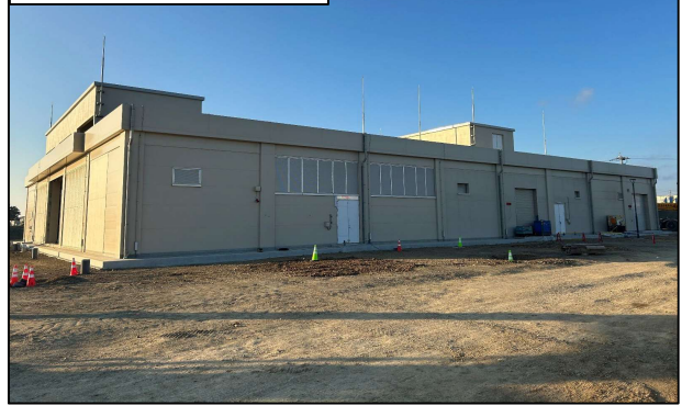
ユーティリティ施設