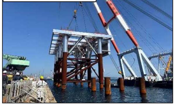
係留施設 本体工事