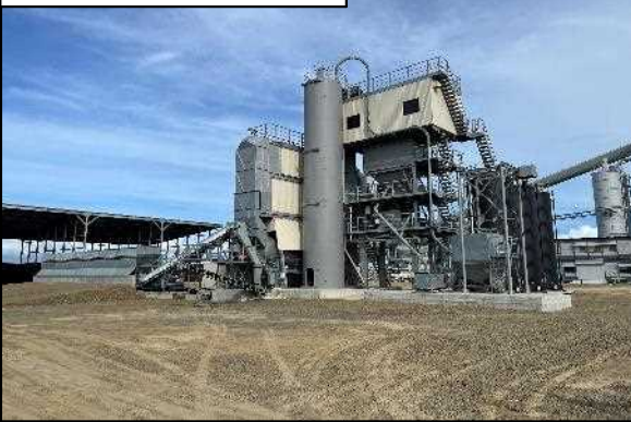
仮設プラント工事