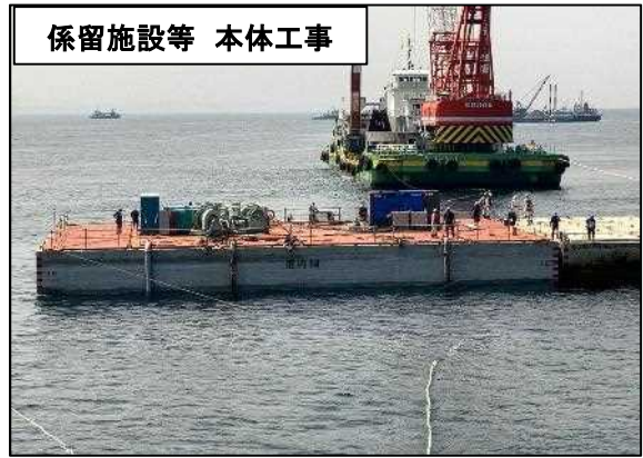
係留施設等 本体工事