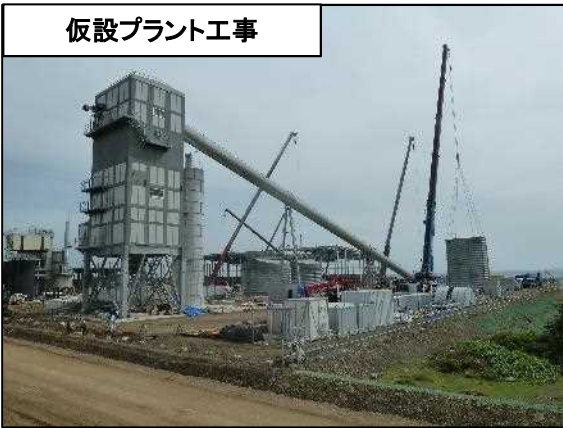
仮設プラント工事