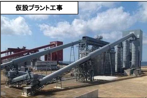
仮設プラント工事