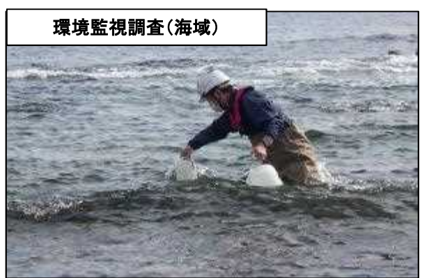
環境監視調査(海域)