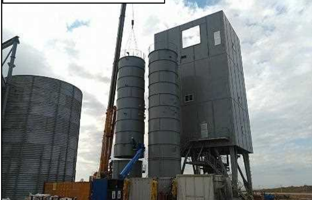
仮設プラント工事