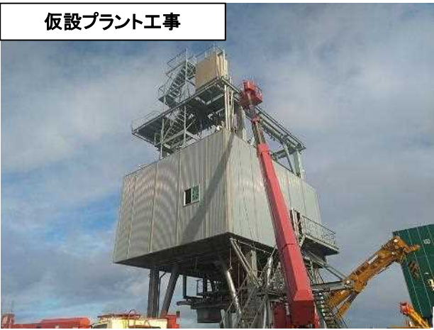
仮設プラント工事