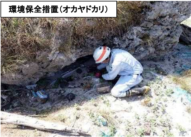
環境保全措置(オカヤドカリ)