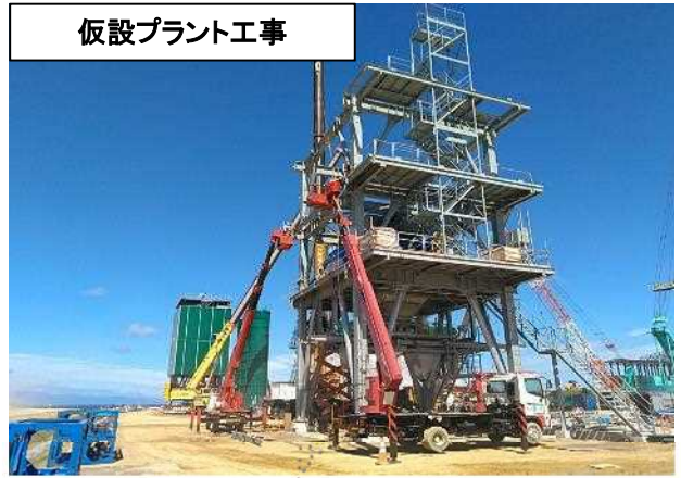
仮設プラント工事