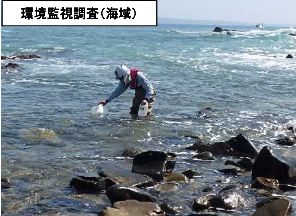
環境監視調査(海域)